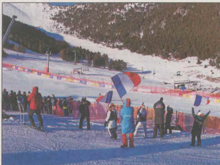
La vaga coincideix amb els Campionats del Món d'Snow

Des d'FGC asseguren que les reivindicacions dels empleats que volen anar a la vaga "superen els límits legals pel que fa als increments retributius i la reducció de la jornada anual" i assenyalen que la secció sindical d'Intersindical-CSC de La Molina és