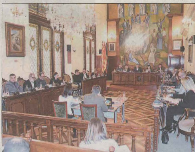
Un moment del Ple celebrat ahir a la Diputació

Els criteris de distribució detallen que hi haurà un 6% fix per EMD; un 50% per a municipis; un 25% en funció del nombre de nuclis de cada municipi, i un 19% segons l'extensió en km2 del municipi. Per la seva banda, l'Ajuntament de Lleida queda exclòs d'aquests criteris i rebrà 81.000 euros de la dotació total. El ple de la Diputació també va donar llum verda al Pla de Cooperació Municipal per fer front a les despeses derivades de la campanya agrària 2023, amb una dotació de 400.000 euros. Atès que la