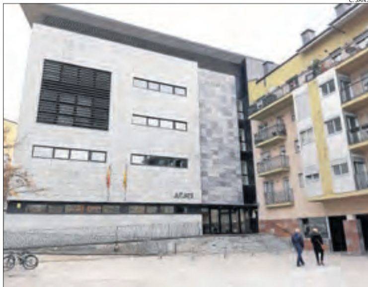
Imatge d'arxiu del jutjat de la Seu d'Urgell.

La investigació –que també va comptar amb la participació d'Europol– va començar el