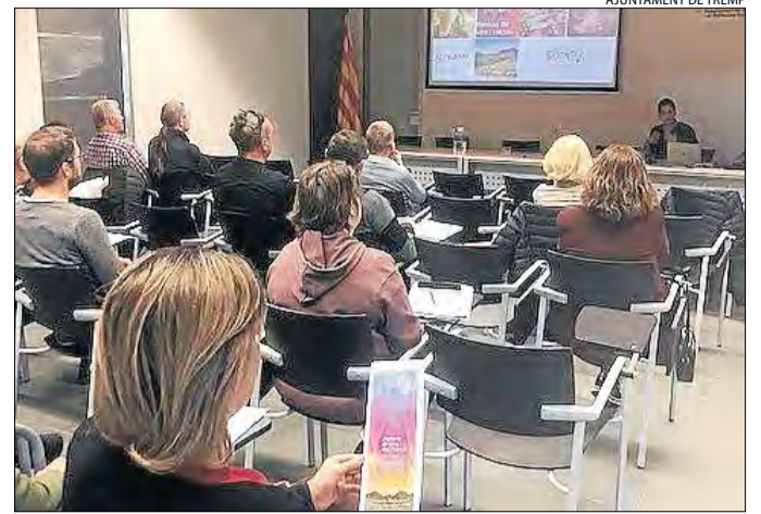
Un moment de la desena edició de la jornada Vins del Pirineu.