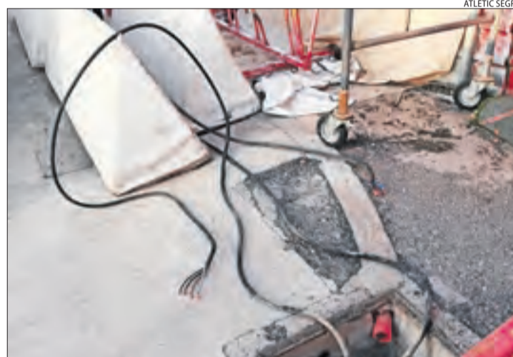
El personal del club va trobar cables arrancats.