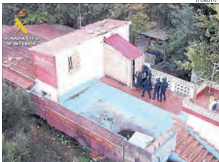
Moment en què els agents entraven a la torre.