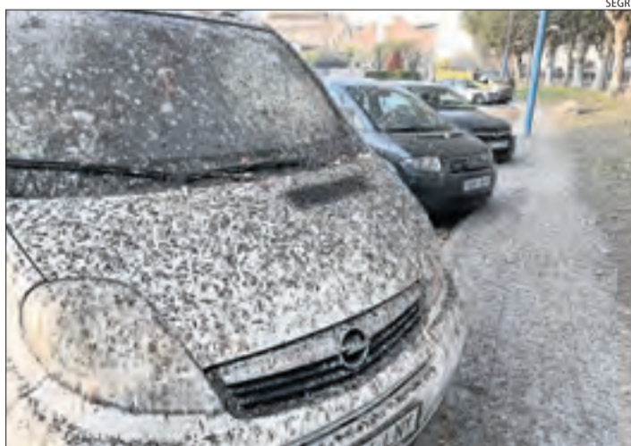
Vehicles i paviment queden coberts d'excrements.