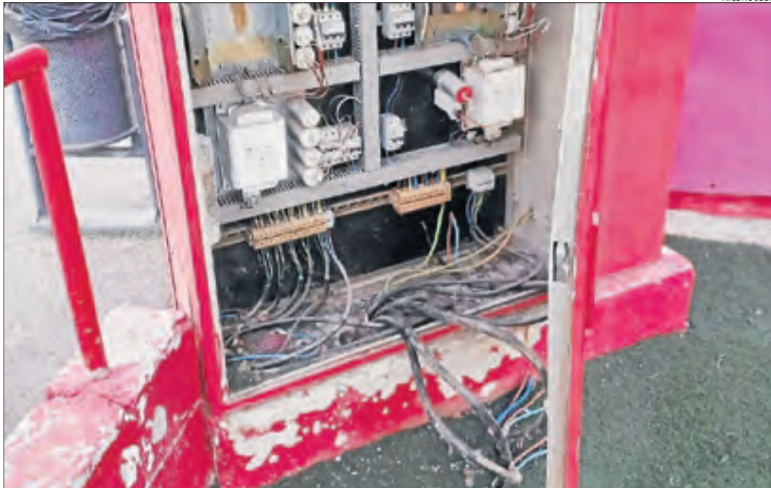
El personal del club va trobar cables arrancats.

per. Les sis gimnastes lleidatanes –a la imatge– van tenir una actuació molt correcta i es van classificar en el lloc 31 sobre un total de 130 equips que participaven en aquesta categoria.