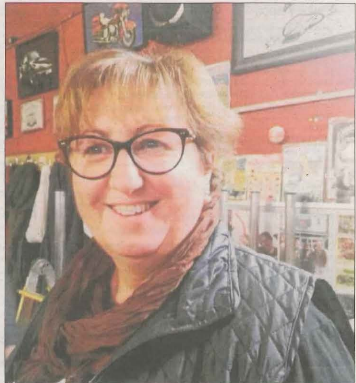
Moltes felicitats, preciosa. Espero que gaudeixis al màxim d'aquest dia.