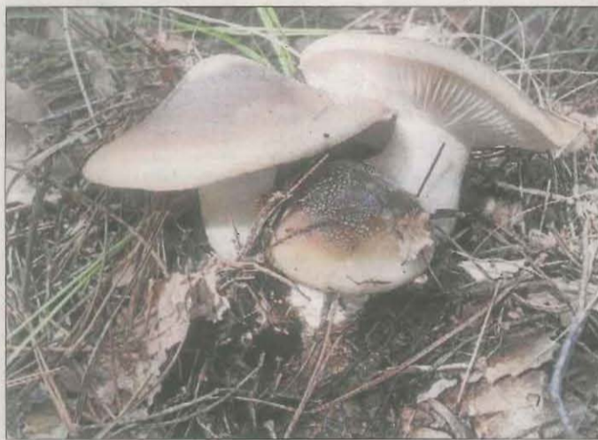
Mocosa. El Ramon va fotografiar aquesta varietat, família del bolet llanega blanca, que va trobar en una sortida al bosc.