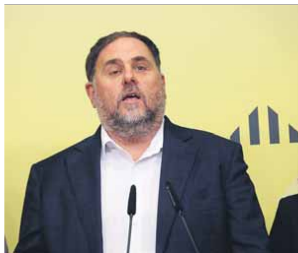
El president d'ERC, Oriol Junqueras, en una imatge presa a la seu del partit, a Barcelona

D'altra banda, el TSJC ha citat per demà els exmembres de la mesa del Parlament —presidida per Roger Torrent— jutjats per desobediència, a recollir la sentència presencialment. En cas que no hi vagin se'ls notificarà mitjançant els procuradors.