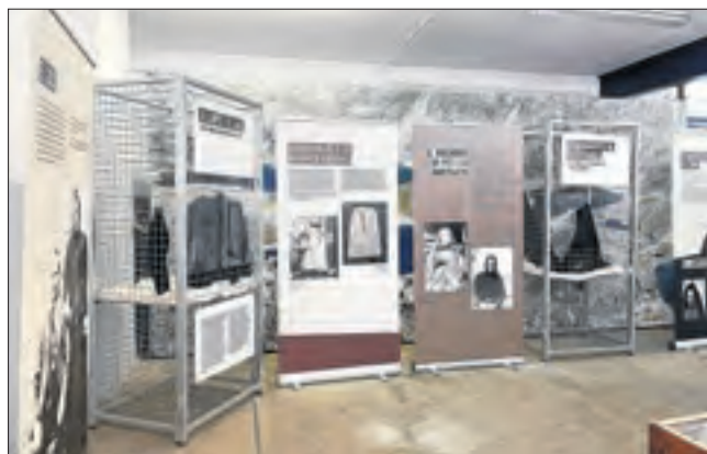
Últims dies d'Enfilant l'agulla'. Museu Hidroel. Vall Fosca.

In the beggining was... La primera exposició permanent a Europa de l'artista japonesa Chiaru Shiota. Permanent.