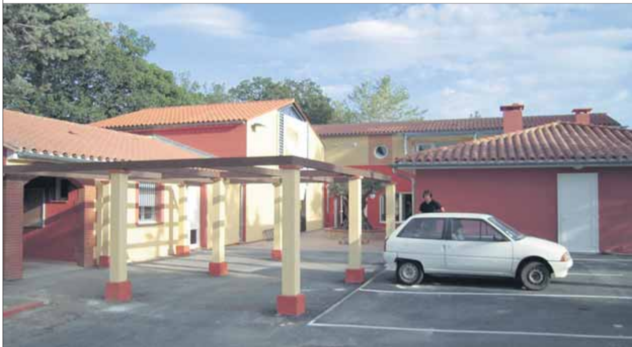
La Casa dels Països Catalans a Perpinyà, on s'imparteixen també les classes del màster de secundària

La situació al carrer, però, ha canviat. Ara el català és acceptat dins la població i, segons una enquesta recent, prop del 60% dels pares voldrien que el seu fill fes català a l'escola. "Hi ha una forta demanda i, en canvi, el percentatge de nens que fan classes en català és baix, al voltant del 8%", assegura. Hi ha centres com ara l'escola pública Arrels i La Bressola, de caràcter concertat, que han contribuït a multiplicar el prestigi de la llengua. "Siguis del país o no, hi ha una bona imatge del català, es veu com un bon suplement, però a l'escola Arrels li limiten el nombre de classes i La Bressola no pot obrir un centre més", lamenta Becat, que quaranta anys després de l'inici del primer curs de diplomatura, la primera d'una llengua regional, veu com "les estructures hi són, però les limitacions encara continuen". ■