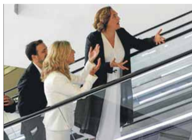
Colau, Díaz i Garzón al Disseny Hub