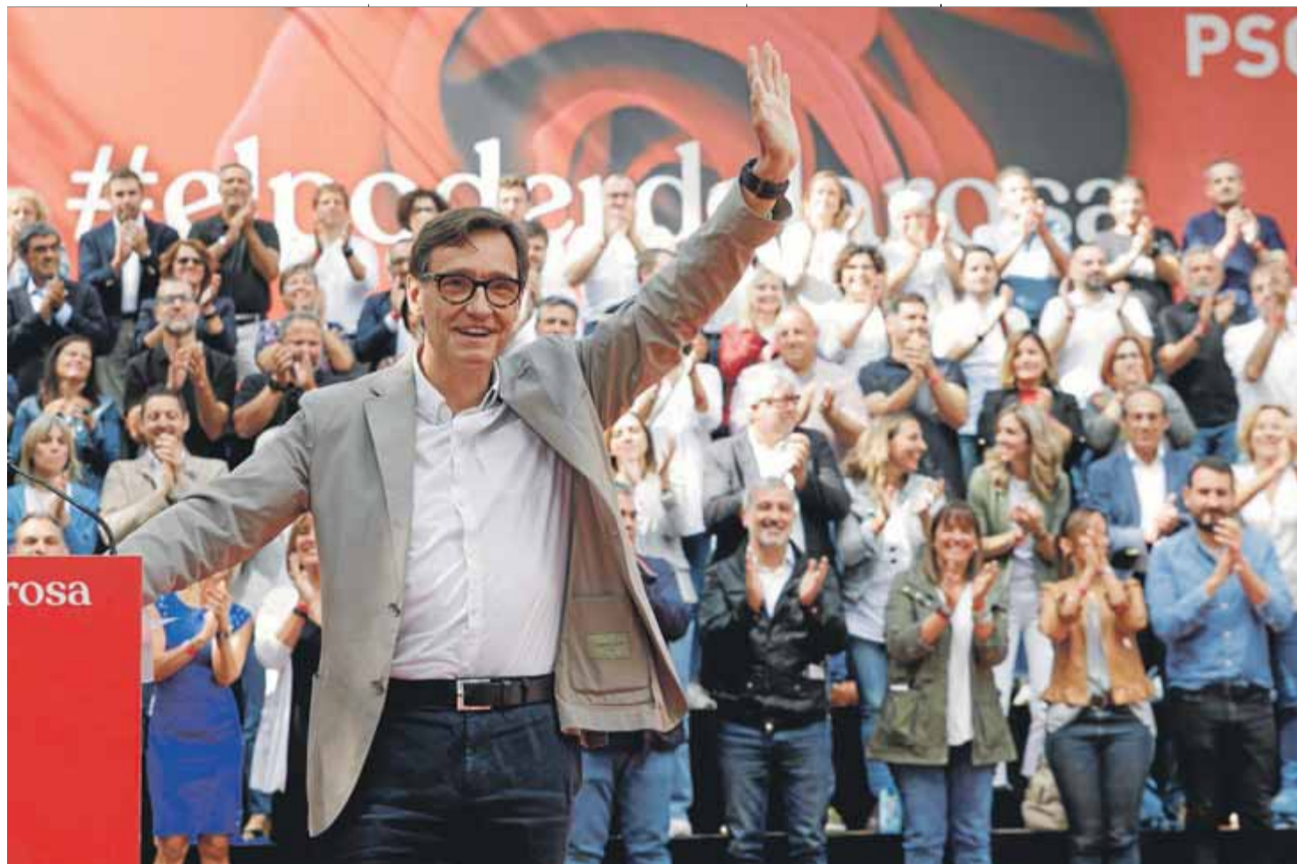
El líder del PSC, Salvador Illa, en la Festa de la Rosa de Gavà del setembre passat

El camí de federalisme pragmàtic del PSC competeix amb l'independentisme pragmàtic favorable a la negociació, amb què aposta per la confrontació, i amb un unionisme de dretes que advoca per recentralitzar o carregar-se l'autogovern. Dins d'aquest panorama, intenta forjar consensos, com el que s'ha aconseguit amb la reforma educativa que elimina percentatges i manté la immersió lingüística. Però com