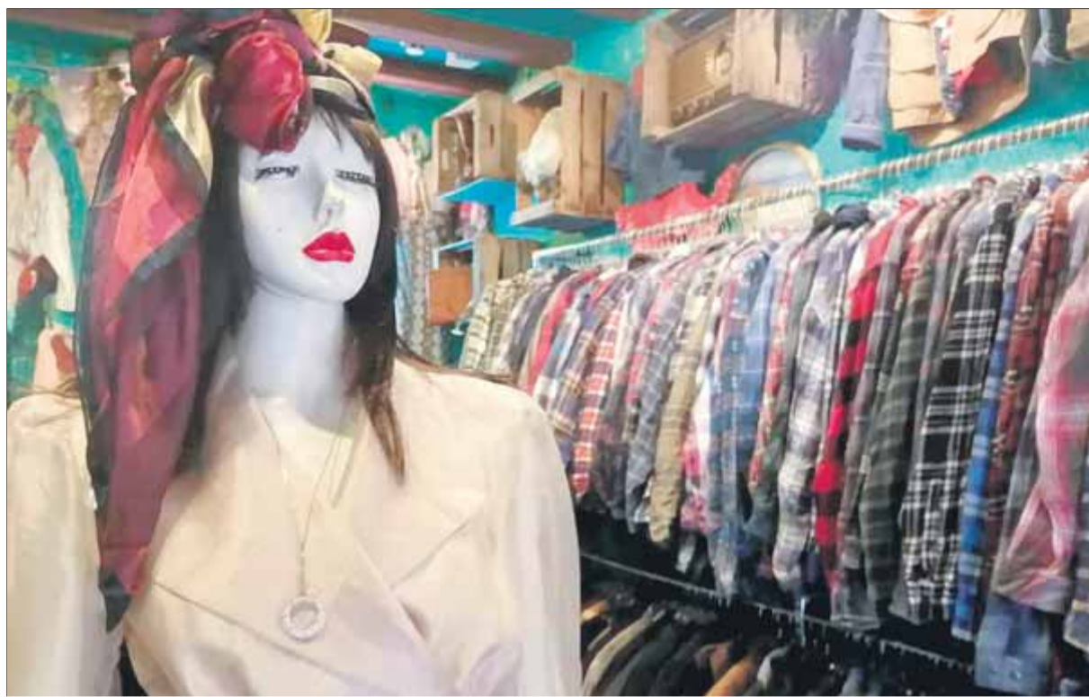
Roba de segona mà com la del Pink Flamingo del carrer Tallers, portaran els i les models en la 080 Reborn