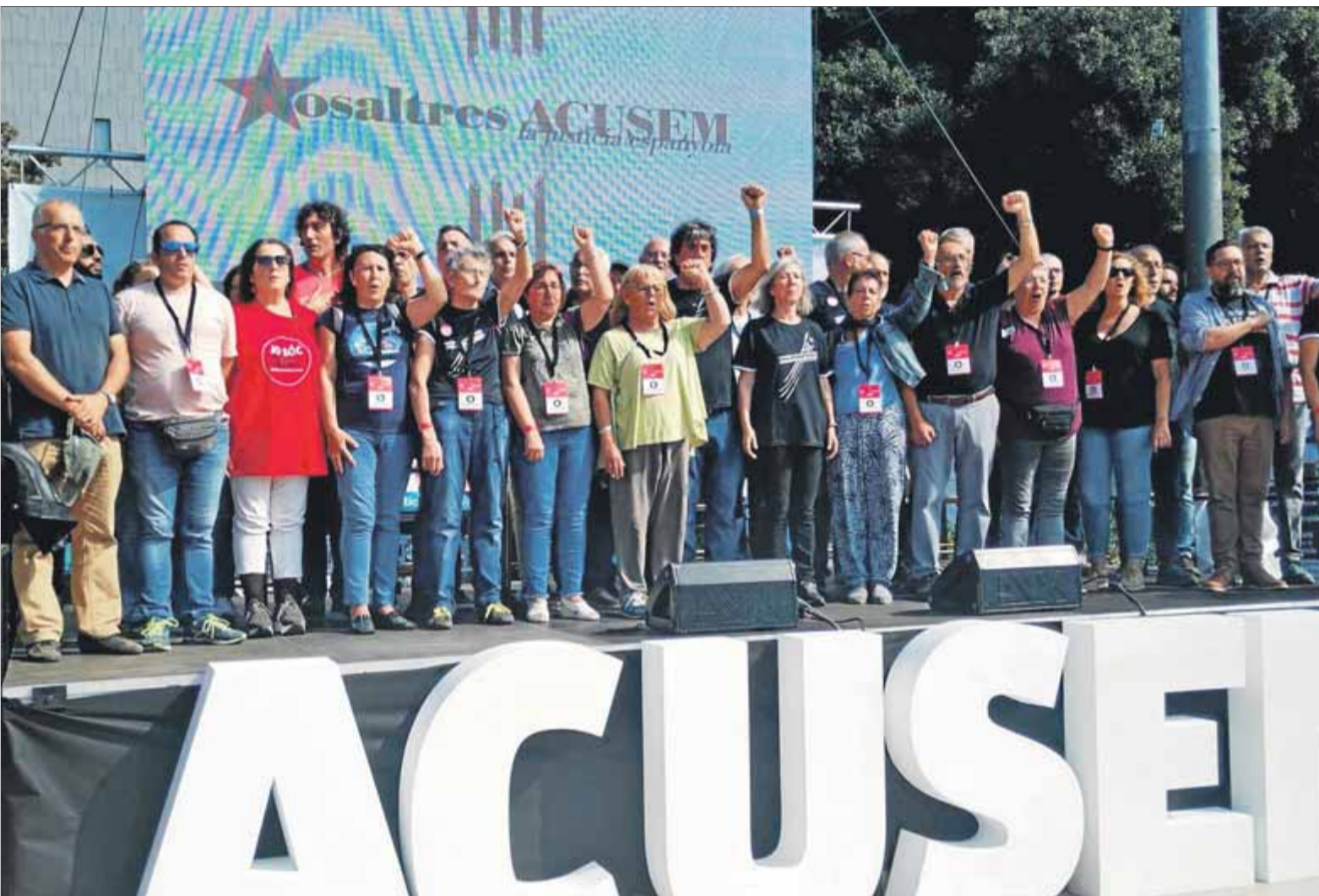
L'executiva de l'Assemblea Nacional, ahir a la plaça Catalunya cantant 'Els segadors' en l'arrencada de l'acampada que denuncia la repressió de l'Estat ■ JPF