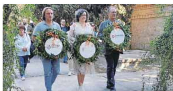
Els representants de les tres entitats de la Federació Lull durant l'ofrena floral a la tomba de Joan Fuster

naments a partir de la llei d'arrendaments urbans van créixer un 59,8% respecte al 2020. En un comunicat, l'associació reivindica una moratòria legal d'almenys tres anys i l'elevació de rang de l'anomenat codi de bones pràctiques. També demana més mesures de "control i supervisió" de l'actuació de la banca i més protecció dels consumidors en un context d'alta inflació. ■ REDACCIÓ