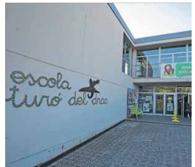
Entrada de l'escola Turó del Drac, a Canet de Mar ■ J.R.

Per les famílies afectades i Òmnium Cultural, aquesta argumentació del tribunal és contrària a l'actual marc normatiu i a anteriors decisions judicials preses pel mateix tribunal. ■