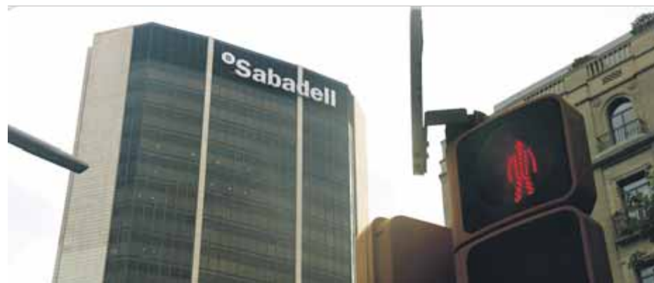
El Banc Sabadell va ser dels primers a traslladar la seu

■ L'argument de la fiscalitat d'avui fa evocar l'èxode per la presumpta "inestabilitat política" posterior a l'1-0