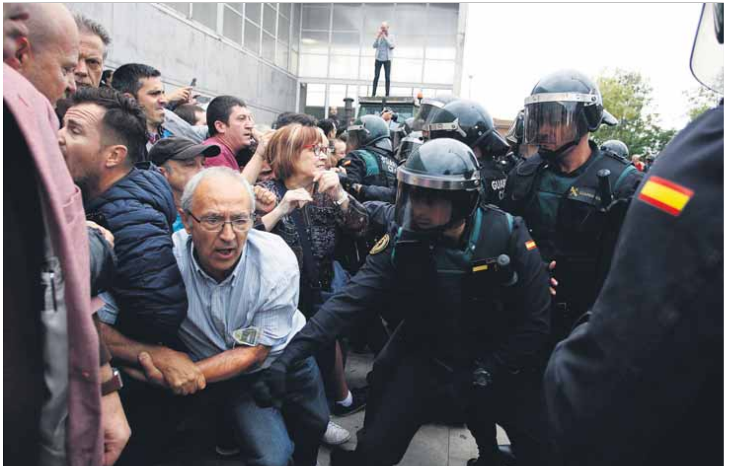
Agents espanyols colpejant ciutadans que defensaven les urnes al pavelló de Sant Julià de Ramis