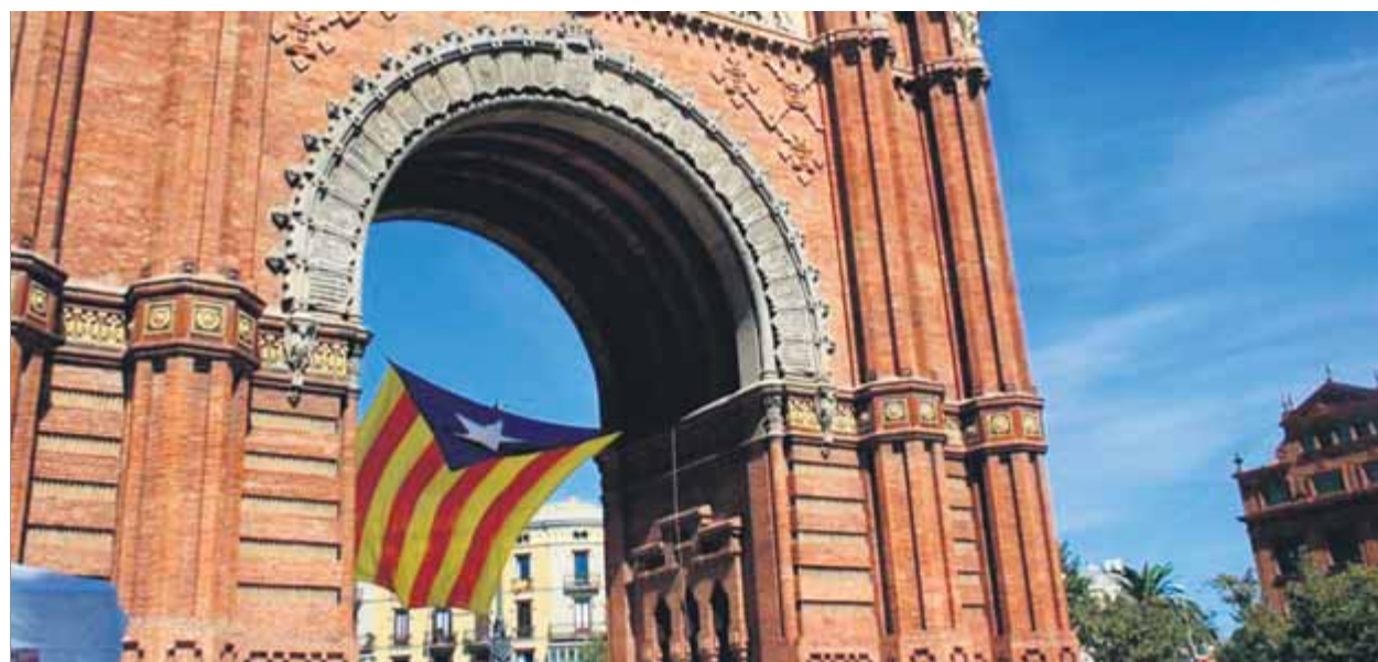
L'Arc de Triomf, a Barcelona, on se celebrarà l'acte unitari convocat per les entitats independentistes ■ A.G.

A banda d'aquesta iniciativa, el dia 1 també està previst que hi hagi un acte organitzat per l'ANC, Òmnium, l'AMI, el Consell de la República, la Cambra de