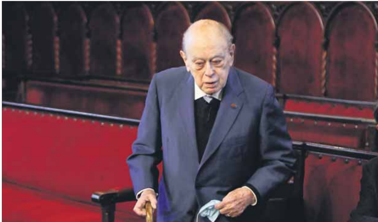
L'expresident de la Generalitat Jordi Pujol en una imatge recent durant una de les últimes aparicions públiques

Segons van explicar els professionals que l'atenen, Pujol va ingressar a les cinc de la tarda provinent de l'hospital de Barcelona per a l'avaluació i tractament d'un ictus. Els símptomes van començar a les onze del matí amb un trastorn del llenguatge quan l'expresident era al seu despatx. Va ser traslladat a l'hospital de Barcelona, on es va confirmar que tenia un ictus per falta de flux sanguini cerebral. D'acord amb l'equip mèdic del centre hospitalari i de la família, es va decidir traslladar el pacient a l'hospital Sant Pau. Quan va arribar i d'acord amb el protocol hospitalari de l'ic-