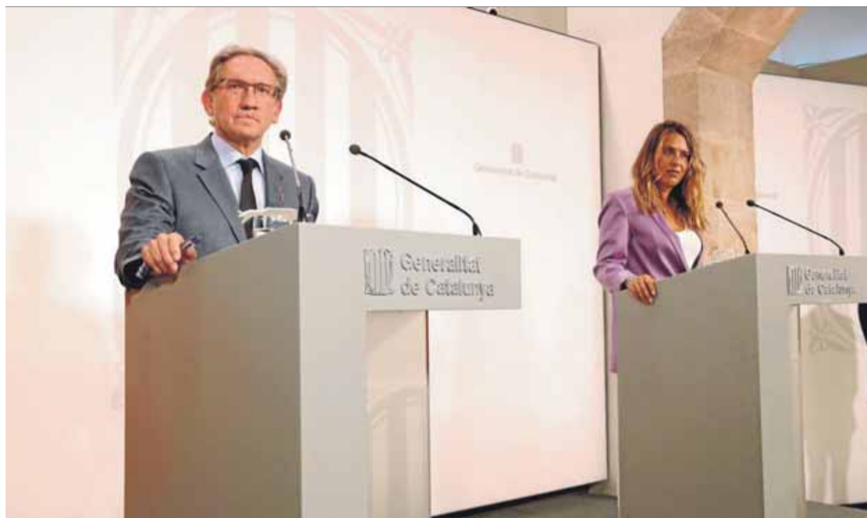
El conseller d'Economia, Jaume Giró, i la portaveu del govern, Patrícia Plaja, ahir al Palau de la Generalitat