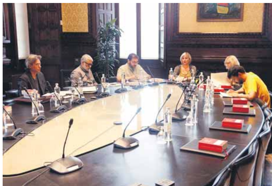
Els membres de la mesa del Parlament reunits ahir

que signa l'exsecretari major del Parlament Xavier Muro, ja justificava la no admissió pels motius següents: primer, la Generalitat no té competències en la matèria, en la independència; segon, aquesta matèria és objecte d'una reforma constitucional; tercer, una ILP no pot abordar aquest tràmit, i, finalment, la DUI a què es refereix la ILP va ser declarada nul·la pel Tribunal Constitucional el novembre del 2017, per tant és “impossible l'adequació a l'ordenament jurídic vigent d'una declaració amb