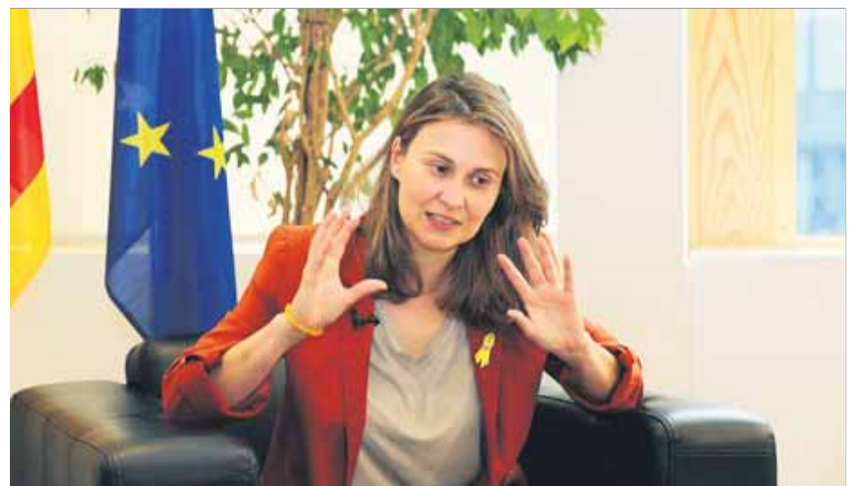
La diputada d'ERC Meritxell Serret serà qui presidirà la comissió de la cambra

constitució formal de l'ens per a la setmana que ve i acordar el pla de treball. Una vegada hi hagi acord, assenyala ERC en un comunicat, tocarà a la vicepresidenta primera del Parlament i actualment en funcions de presidenta, Alba Vergés, convocar la sessió constitutiva de la comissió. ■