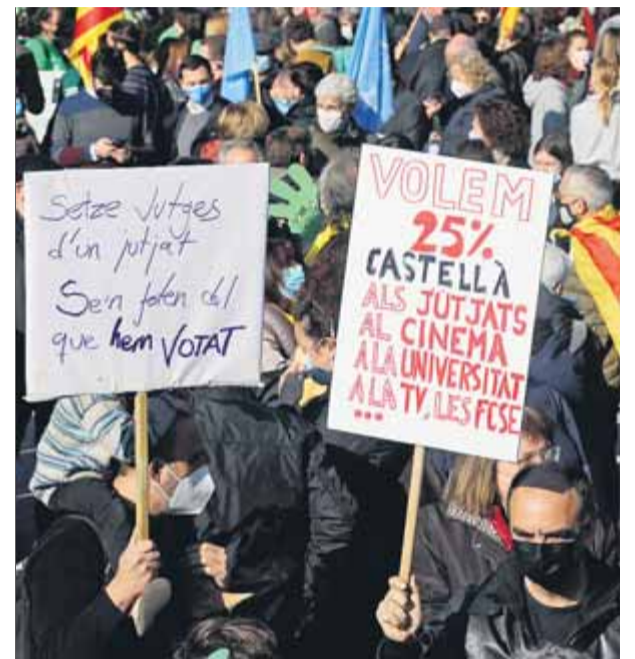
Pancartes en contra de la sentència del 25% en una manifestació a Barcelona el desembre del 2021 ■ J.R.

Quan li van preguntar si veia justes les quantitats que l'Estat atorga a Catalunya, Giró va ser contundent: “El que voldria és fer un pressupost de 50.500 milions, que és el que ens pertocaria.” ■