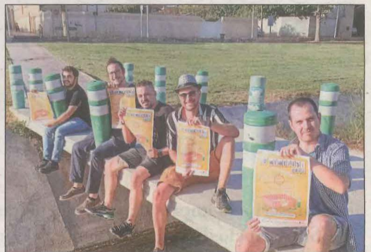
Presentació de l'edició d'enguany del festival

Així ho van donar a conèixer ahir a la tarda davant els mitjans de comunicació membres