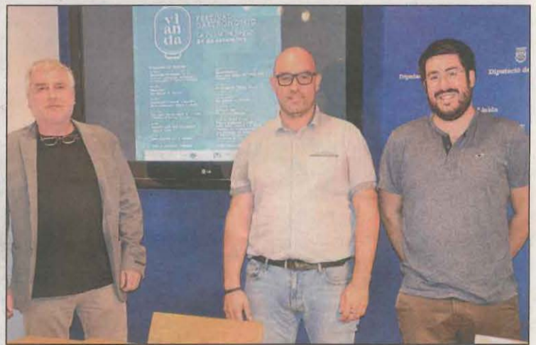
Ahir es van donar tots els detalls del certamen