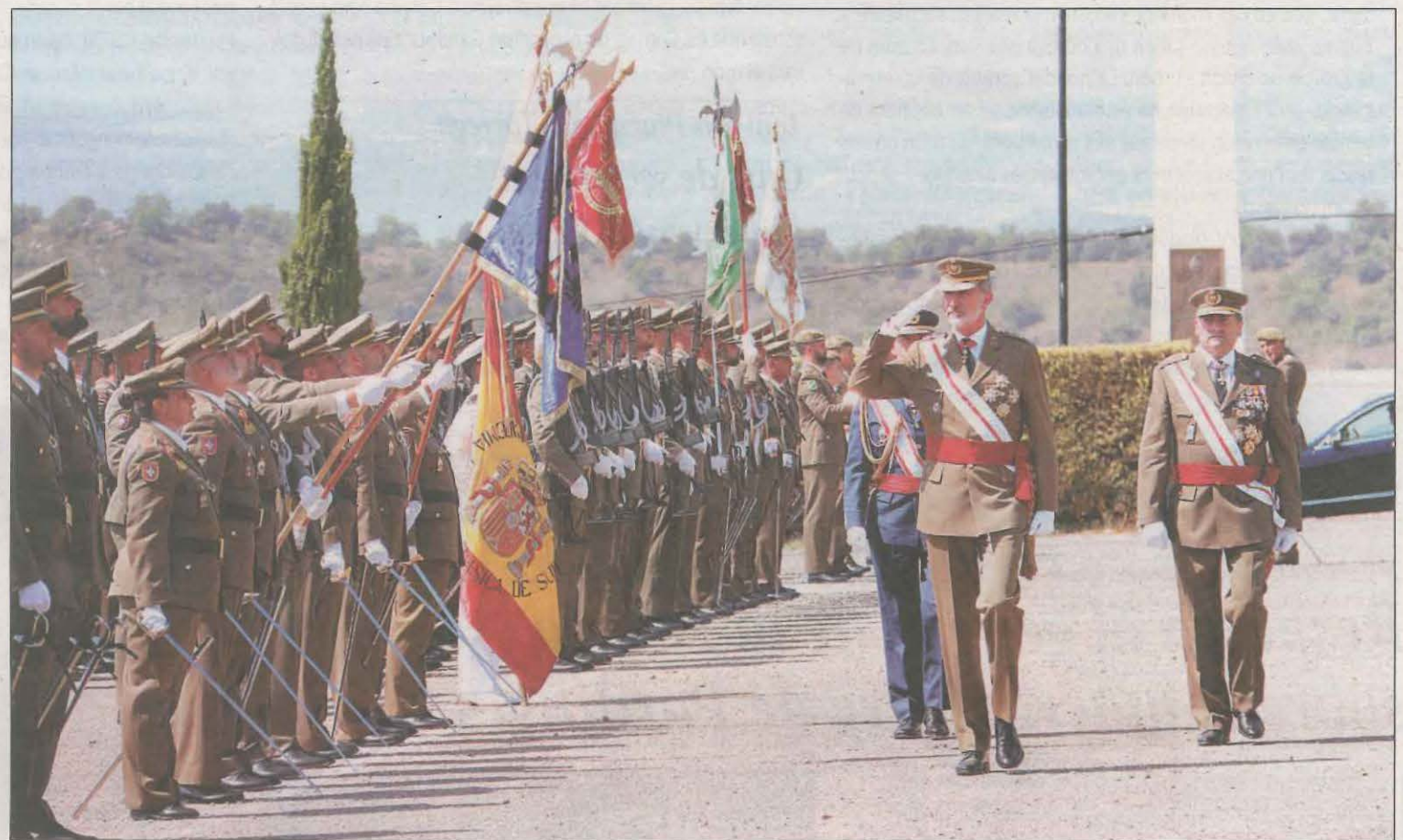
El rei Felip VI passant revista a la tropa a l'Acadèmia Militar de Talarn