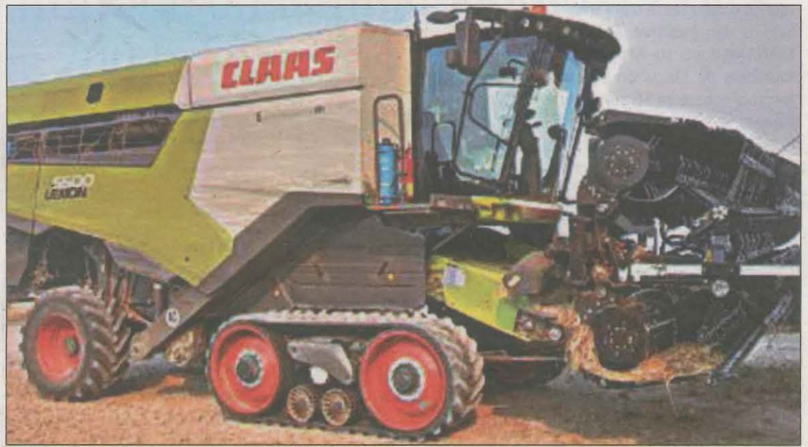
Una màquina recol·lectora de cereal va ser la causant de l'incendi a Rocallaura

Els fets es van originar a les 17.10 hores de dilluns en un camp de blat de Rocallaura. En un primer moment, els Bombers van activar 31 dotacions, 8 d'elles aèries; un parell d'hores més tard, van arribar a comptar amb 46 dotacions desplegades sobre el terreny, 11 de les quals eren aèries. A última hora de la tarda, van treballar-hi un total de 62 dotacions dels, 13 de les quals aèries. A última hora del vespre, els Bombers tenien el foc encer-