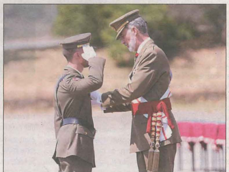
El rei durant l'entrega dels despatxos als nous sargents

del coronavirus i una guerra en territori europeu són la terrible manifestació que vivim en un entorn caracteritzat per la volatilitat, la incertesa, el treball en equip i la confiança amb el responsable