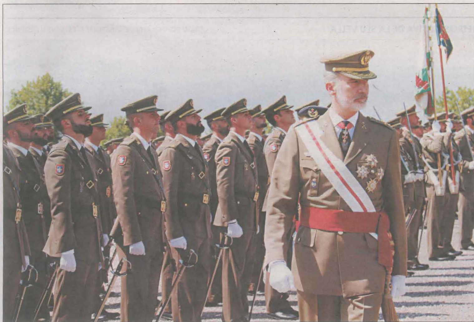
El monarca Felipe VI presidió el acto celebrado ayer en la Academia General Básica de Suboficiales de Talarn

El Govern planta al Rey en la entrega de los despachos a los suboficiales en Talarn