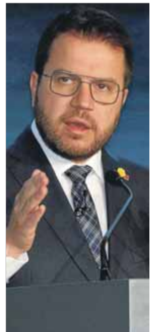
El president de la Generalitat, Pere Aragonès ■

Finalment, va destacar que el Pirineu mereix