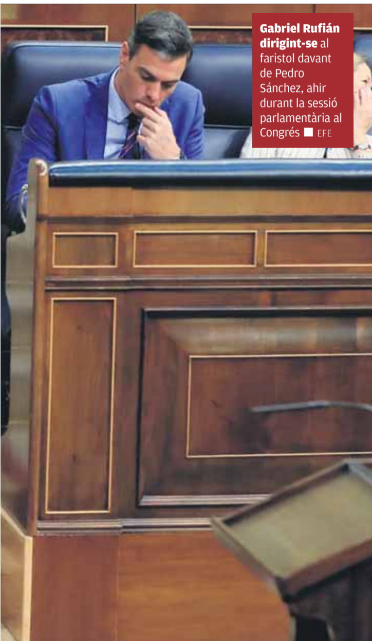
Gabriel Rufián dirigint-se al faristol davant de Pedro Sánchez, ahir durant la sessió parlamentària al Congrés

Íñigo Errejón (Més País) va deixar una lliçó política a l'inquilí de La Moncloa sobre "el conflicte permanent dins l'Estat" i els límits del PSOE: "Hi ha un desequilibri. Quan la dreta és al govern té tot el poder de l'Estat, i quan hi és l'esquerra és un mer inquilí." "Que el CNI sigui una cèl·lula autònoma que es permet elegir objectius en una matèria tan delicada com la política és molt greu", advertia Aitor Esteban (PNB).