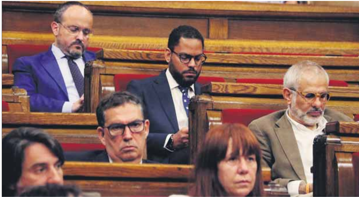
Els líders del PP, Vox i Cs, asseguts un darrere l'altre al Parlament dimecres durant la sessió de control

El govern estava decidit a esperar la llei per tirar endavant el decret, però ja té clar que ho avançarà per driblar la maniobra dilatòria ahir dels grups contraris a la immersió. L'executiu considera que amb el blindatge del decret llei n'hi hauria prou com a primera mesura, si bé possiblement caldria retocar-ne alguna part. En espera de saber-ne el detall, a grans trets el decret fixarà els criteris sobre com s'elaboren