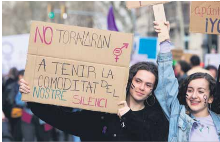
Les mobilitzacions feministes van agafar més força després de la sentència de La Manada l'any 2018

portant que introdueix la norma és que elimina la distinció entre abús i agressió sexual. El text estableix que l'agressió sexual serà "qualsevol acte que atempti contra la llibertat sexual d'una altra persona sense el seu consentiment". I es considerarà violació, amb penes de presó més elevades, quan l'agressió "consisteixi en accés carnal per via vaginal, anal o bucal, o introducció de membres corporals o objectes per alguna de les dues primeres vies".