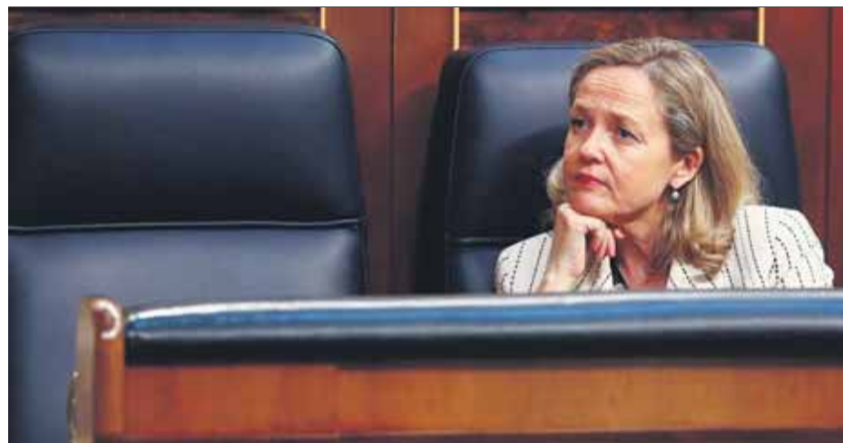
La vicepresidenta Calviño va poder aprovar la llei audiovisual gràcies al PP

A Junts, Nogueras, que des del primer dia cita la Directiva d'Intel·ligència lliurada el març del 2019 al CNI com la clau de volta de tot, va esclatar: "Es pensa que som estúpids. Vostè és el màxim respon-