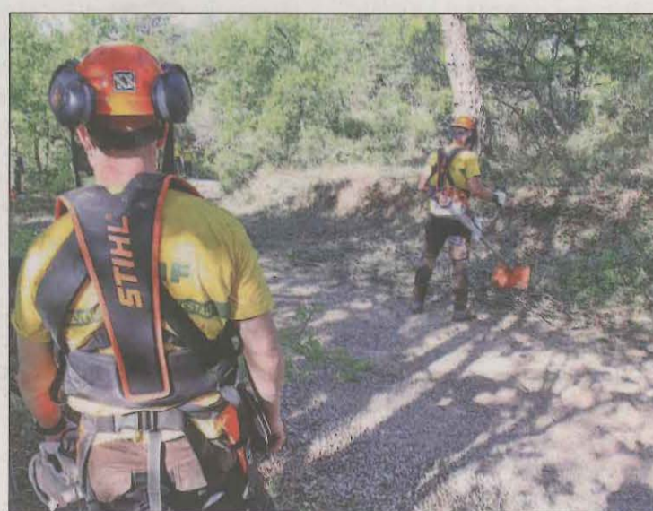
Membres del Grup Especial de Prevenció d'Incendis

"El canvi climàtic i altres factors fan que el risc el tinguem tot l'any amb moments especialment delicats i aquest n'és un", va indicar el conseller, que va recordar l'incendi de Roses del mes de febrer passat en què van