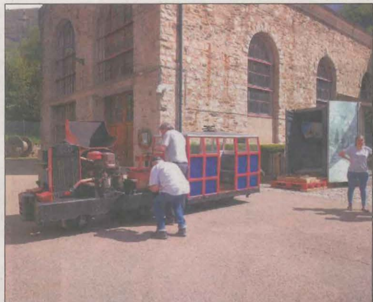
La Torre de Capdella va posar en marxa 'La Rúbia'

El Museu de Cervera, per exemple, va inaugurar l'exposició virtual El Sindicat Agrícola de Cervera i sa comarca. Històries en primera persona , mentre que el Museu Hidroelèctric de la Torre de Capdella va posar en marxa La Rúbia , la locomotora que va funcionar fins al 1990 a les obres d'interconnexió de llacs. El tren i la vagoneta que es troba a les