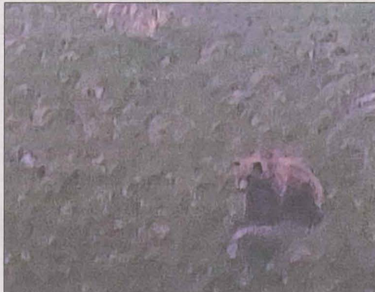
Aquest os campa ara per la Vall de Varradós, a l'Aran