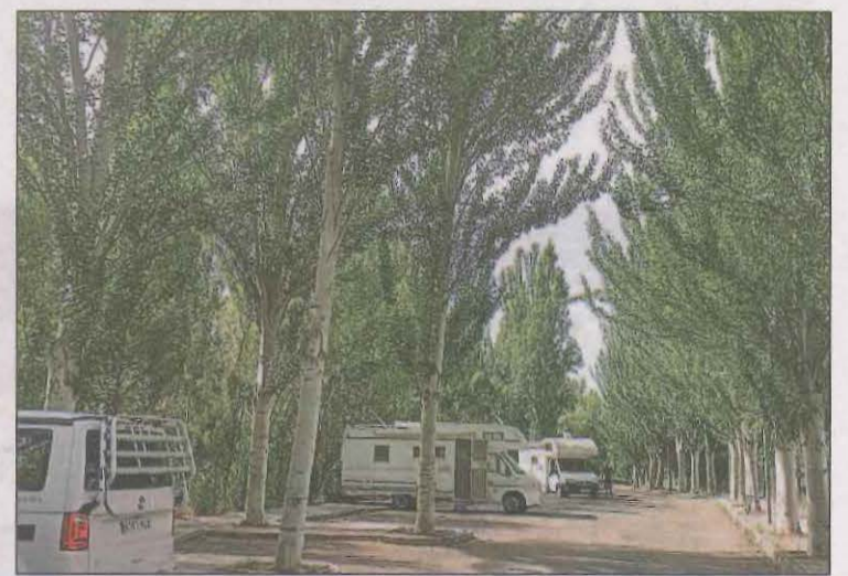
Zona d'autocaravanes de la Pobla de Segur

L'Ajuntament de la Pobla de Segur ha sol·licitat una subvenció a la convocatòria extraordinària de Plans de Sostenibilitat Turística en Destins del Ministeri d'Indústria, comerç i Turisme. El projecte, anomenat "La Pobla de Segur: natura i turisme actiu sostenible" està pressupostat en 2.700.000 €, té un període d'execució de tres anys, i pretén dur a terme un conjunt d'actuacions que la converteixin en centre de referència del turisme actiu, esportiu i d'ecoturisme. Aquest projecte pretén convertir la Pobla en un centre de referència del turisme actiu, esportiu i d'ecoturisme del Pirineu, dotant-la dels equipaments necessaris, treballant conjuntament amb els professionals del sector i acompanyant a les empreses en la creació i comercialit-