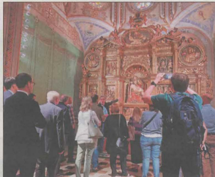
Participants en l'activitat al Museu Diocesà d'Urgell

El Museu Diocesà d'Urgell va inaugurar la museïtzació de la capella de la Pietat i avui i demà oferirà visites guiades amb inscripció prèvia, mentre que el de la Val d'Aran va acollir una con-