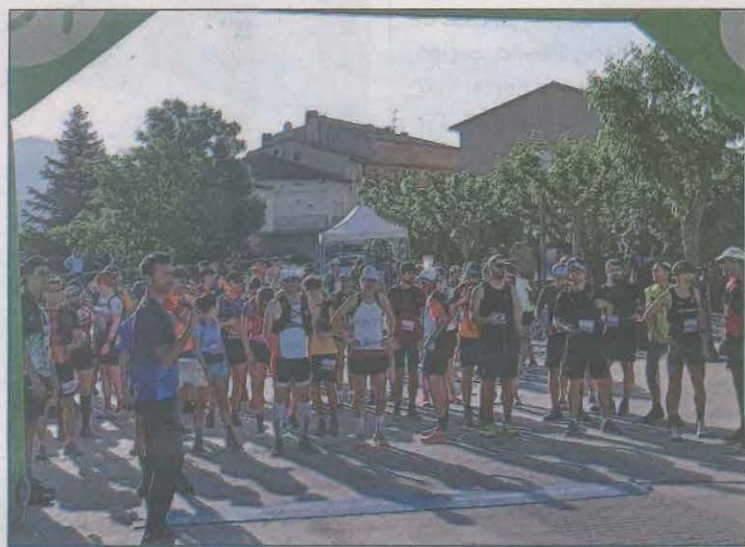
La salida se dio en la localidad de Tremp