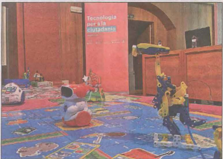
Més de 1.500 persones han participat a la segona edició

La segona edició de la 'Mobile Week' celebrada a la Seu d'Urgell va tancar portes dissabte amb una bona participació i organització, tal com demostren les 1.530 participacions, tant de manera presencial com per streaming, durant els cinc dies d'aquesta iniciativa promoguda per la Mobile Word Capital.