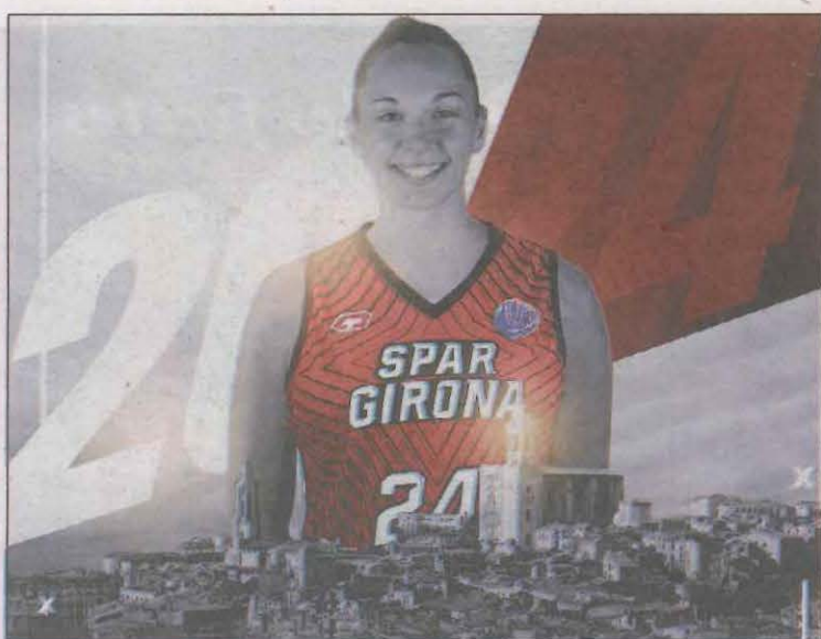
El club anunció ayer la contratación