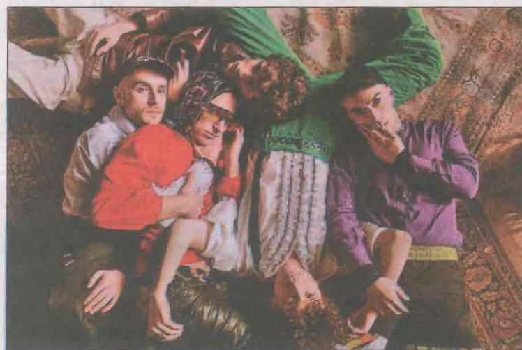
El grupo catalano-francés-alemán ya tiene disco

'Vivir más' es el álbum de debut del grupo catalano-francés-alemán Habla De Mí En Presente que el 16 de julio aterrizará en el Talarn Music Experience. El disco, del que han salido tres adelantos, contiene 11 canciones en catalán y castellano con un estilo nuevo que parte de la rumba y el tecno alemán para ceder en el pop.