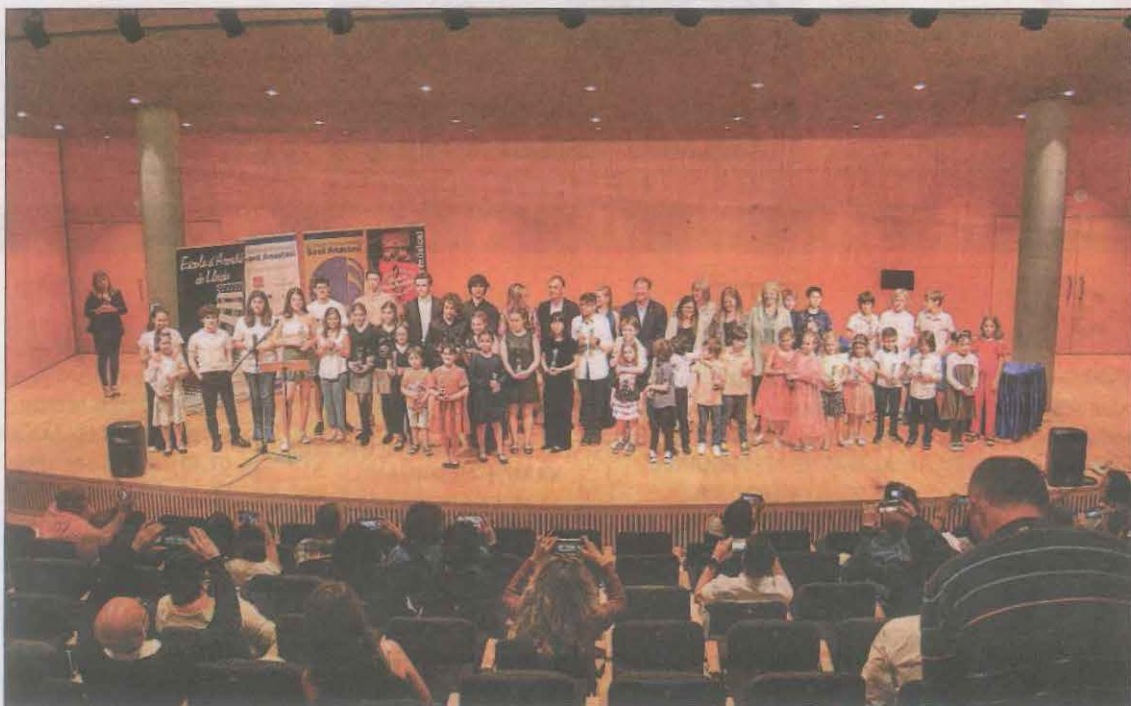
En esta 21ª edición se presentaron 120 aspirantes procedentes de toda España y Andorra