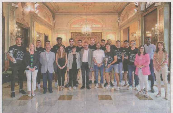
La plantilla del primer equipo estuvo en la Paeria

La Paeria acogió ayer la recepción al Vòlei Balàfia Lleida con motivo de la exitosa campaña de su primer equipo, el Rodi Balàfia, en la categoría de Primera Nacional y en la fase de ascenso celebrada hace unas semanas en Marbella, que ha permitido al club leridano clasificarse por