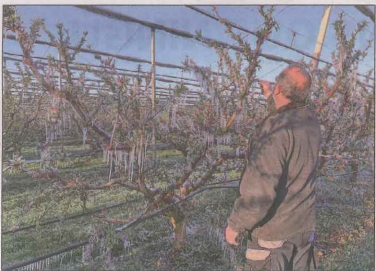
Un pagès d'Ivrs d'Urgell mirant els danys de les gelades

Fruit de la primera reunió a Corbins (Segrià) just després de l'episodi de gelades, Acció Climà-