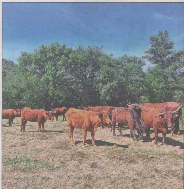
S'ha fet a l'explotació ramadera Cal Tomàs

Durant mig any s'ha fet un exhaustiu seguiment (controls de sang, de pes, d'alimentació, d'engreix o de creixement, entre d'altres) a 24 vedells: vuit alimentats amb pinso, vuit amb pinso i farratge i vuit a base d'unifeed i pastura. I les dietes amb major proporció de farratge han presentat valors més elevats d'àcid linoleic conjugat (CLA), associat