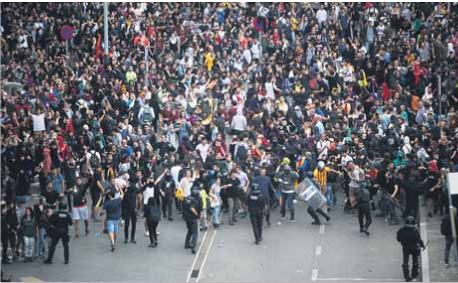
La gentada que va col·lapsar l'aeroport del Prat el dia de la sentència ■ ORIOL DURAN