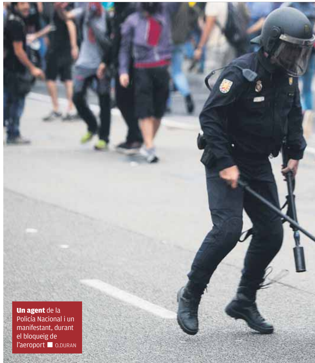
Un agent de la Policia Nacional i un manifestant, durant el bloqueig de l'aeroport

d'algunes persones” que es va traduir amb el llançament d'objectes a la policia. Com a prova del clima extrem que s'hi va respirar, es destaca el nombre de ferits que van necessitar assistència que es van comptabilitzar, gairebé 600. Davant d'això, s'ha identificat una resposta policial que, en alguns casos, és qualificada literalment de “desproporcionada”, i que se circumscriu, essencialment, en les moltes càrregues que van fer les unitats antidisturbis per intentar sufocar els aldarulls. Per ser més precís, l'informe parla d'intervencions “acompanyades de cops de porra a discreció, sense que es constati en aquelles persones en concret ni un comportament previ provocador ni una actitud més que de resistència o oposició passiva”. Igualment, es critica el desplegament específic que es va fer el 17 d'octubre i que no va evitar que una marxa d'ultradreta acabés amb agressions al centre de Barcelona; que en certs moments es fes servir la tècnica del carri-sel —una furgoneta policial fent maniobres a gran velocitat per foragitar els manifestants—; que alguns escopeters no anessin degudament identificats o “l'ús inacceptable i excessiu del material antiavalots”. Preguntant explícitament al respecte, Ribó va afirmar ahir, durant la presentació d'aquestes conclusions, que aquests comportaments s'havien detectat tant en agents dels Mossos d'Esquadra com de la Policia Nacional. Igualment, i davant d'això, va instar a fer