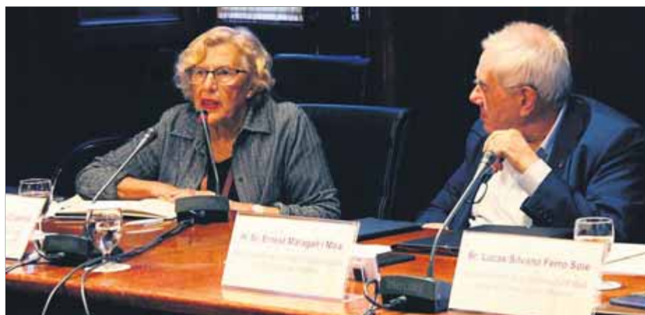
Manuela Carmena, ahir, amb el president de la comissió, Ernest Maragall