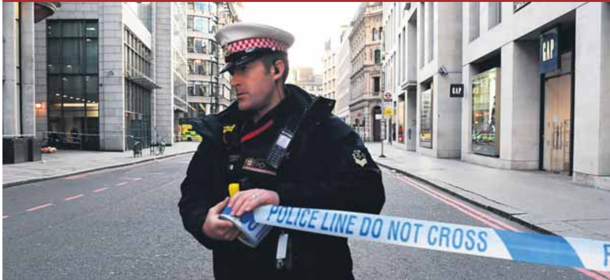
Un policia instal·la una cinta per tallar els carrers al voltant del pont de Londres, després del tiroteig ■