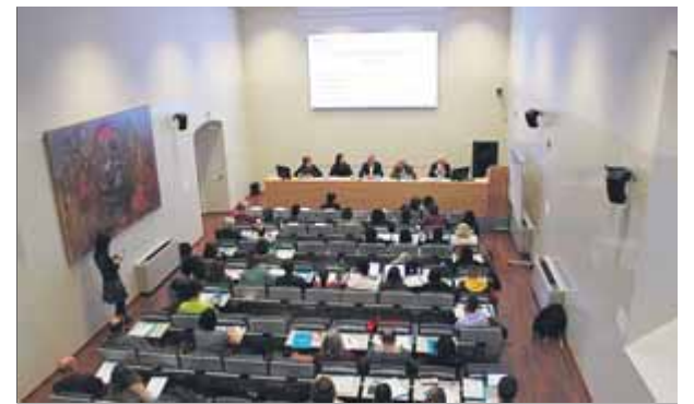
Jornada a la Facultat de Psicologia de la UdG

Col·legiat des de 1986, els dos primers anys vaig aprofitar alguns cursos sobre temes que no havia tocat durant els estudis i sobre possibles sortides professionals. Des d'aleshores –i fa més de 30 anys!– no n'he aprofitat res, però he anat pagant les quotes que fixaven unes juntes de govern, escollides per menys del 10% dels col·legiats, alguns membres de les quals, com en altres col·legis professionals, en feien un modus vivendi , aquí i a Madrid. En la meua trajectòria professional en l'àmbit organitzatiu ningú no m'ha demanat mai si estava col·legiat o no –a la clínica sí que ho exigeixen sovint–. Tanmateix, pagava les quotes. Fins a l'1-O.