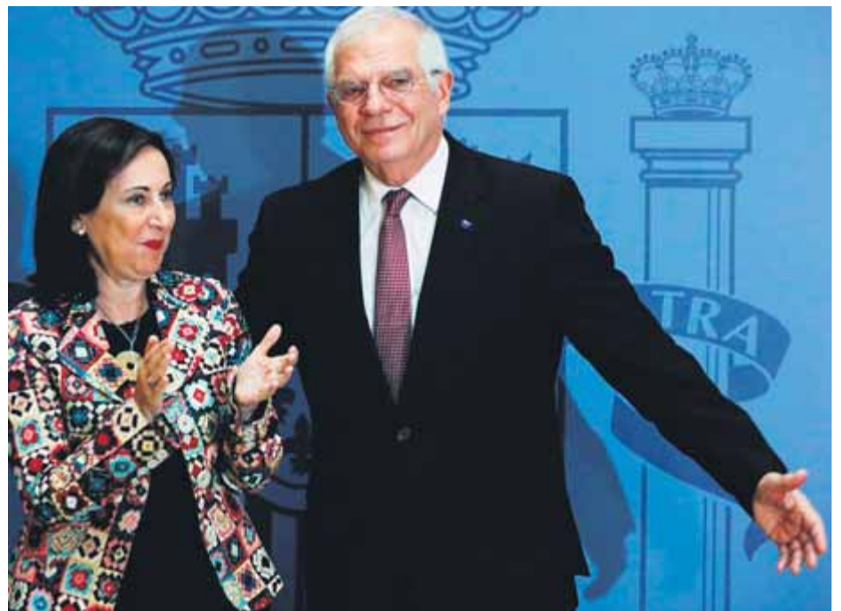
Borrell acomiadant-se del seu càrrec de ministre, acompanyat per Margarita Robles