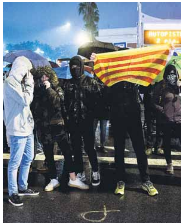
Membres del CDR de Sant Andreu de Barcelona, durant un tall de trànsit a la Meridiana

ser detingudes acusades de terrorisme i set d'elles van ser ingressades en presó preventiva a Madrid. La resolució presentada ahir per les tres formacions sobiranistes defeneix els presos polítics