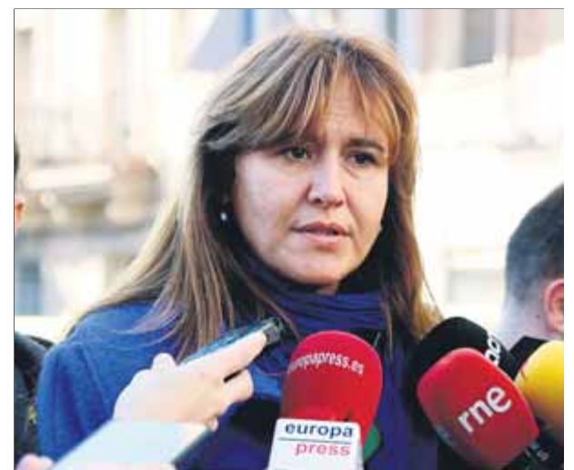
Laura Borràs fa declaracions als periodistes en una imatge d'aquest novembre

Ahir mateix, però, en declaracions al Parlament posteriors a la publicació de l'entrevista, la portaveu de JxCat al Congrés va reconèixer que Aragonès s'havia referit a “l'homologació de rangs” en unes futures negociacions bilaterals i ho va considerar una posició que ella mateixa subscriu. ■