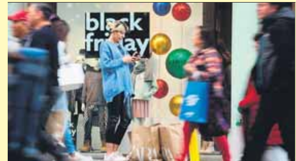
Ambient de compres al centre de Barcelona, ahir