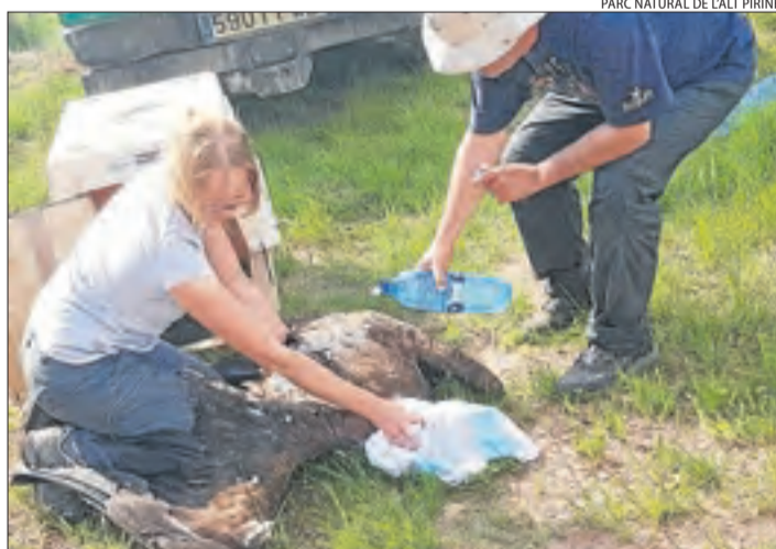
PARC NATURAL DE L'ALT PIRINEU

Membres d'entitats treballant amb un dels voltors.