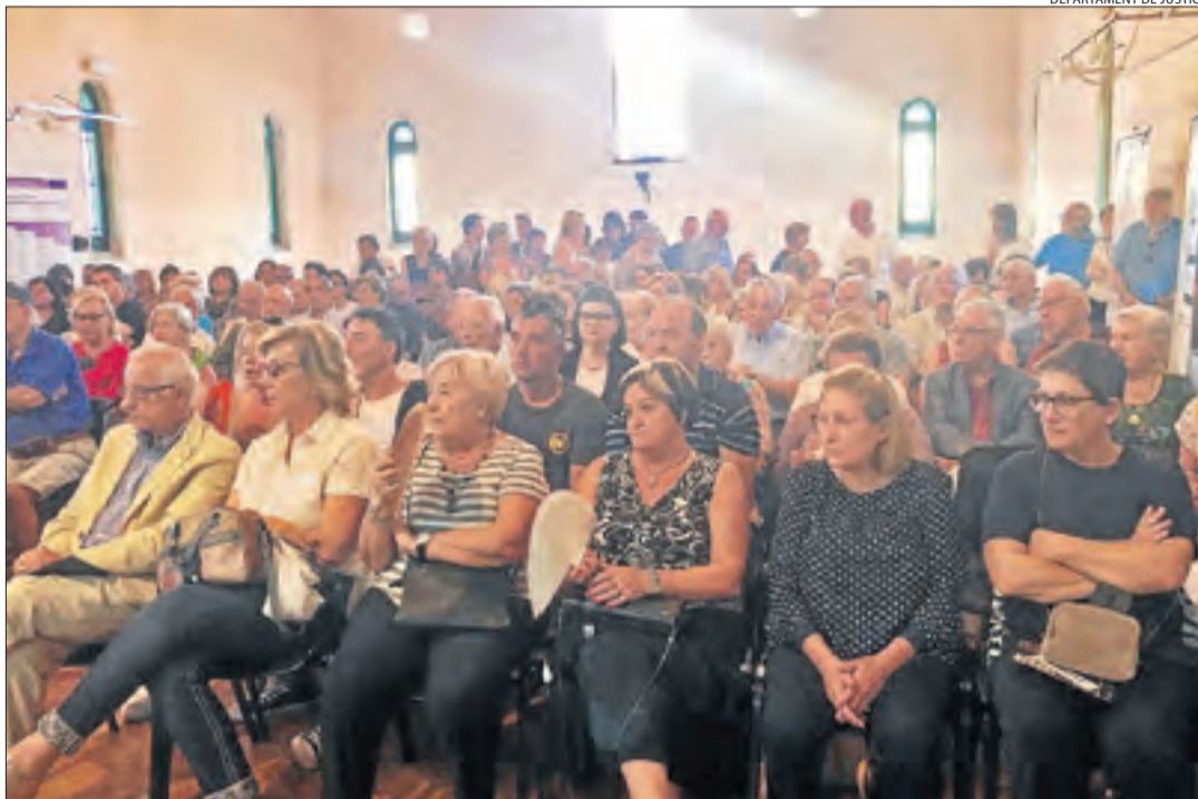
DEPARTAMENT DE JUSTÍCIA

El sentit homenatge de la Pobla es va fer amb una sala abarrotada de públic.