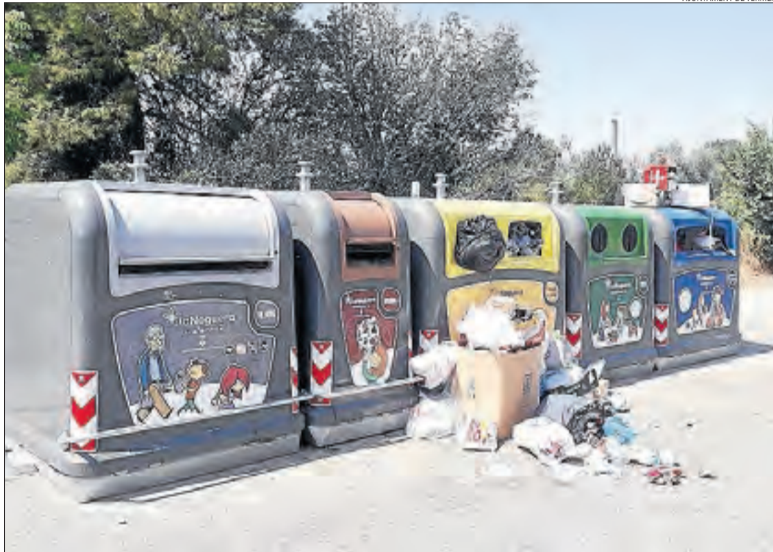
AJUNTAMENT DE TÈRMENS