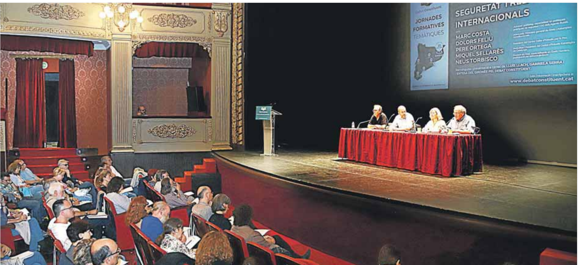
Les ponències es van realitzar ahir al matí al Teatre Municipal de Girona i els assistents van omplir gairebé totes les butaques de la platea