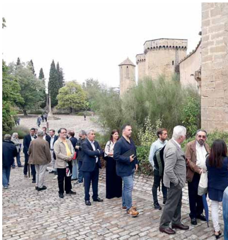
Alguns dels assistents a la jornada, fent cua per accedir al Palau de l'Abat de Poblet

“Ens inspiren els vectors de la catalanitat, el