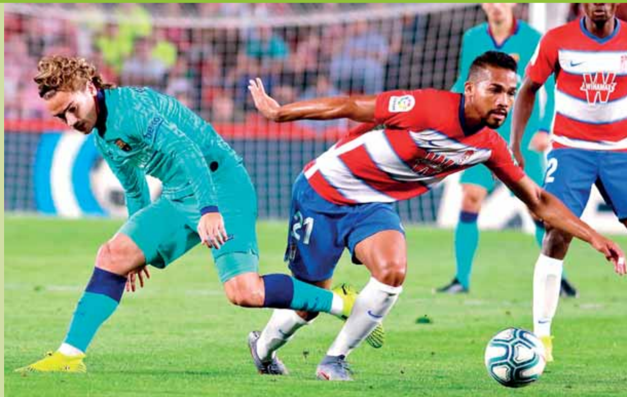
Yangel supera Griezmann durant el partit d'ahir al Nuevo Los Cármenes de Granada