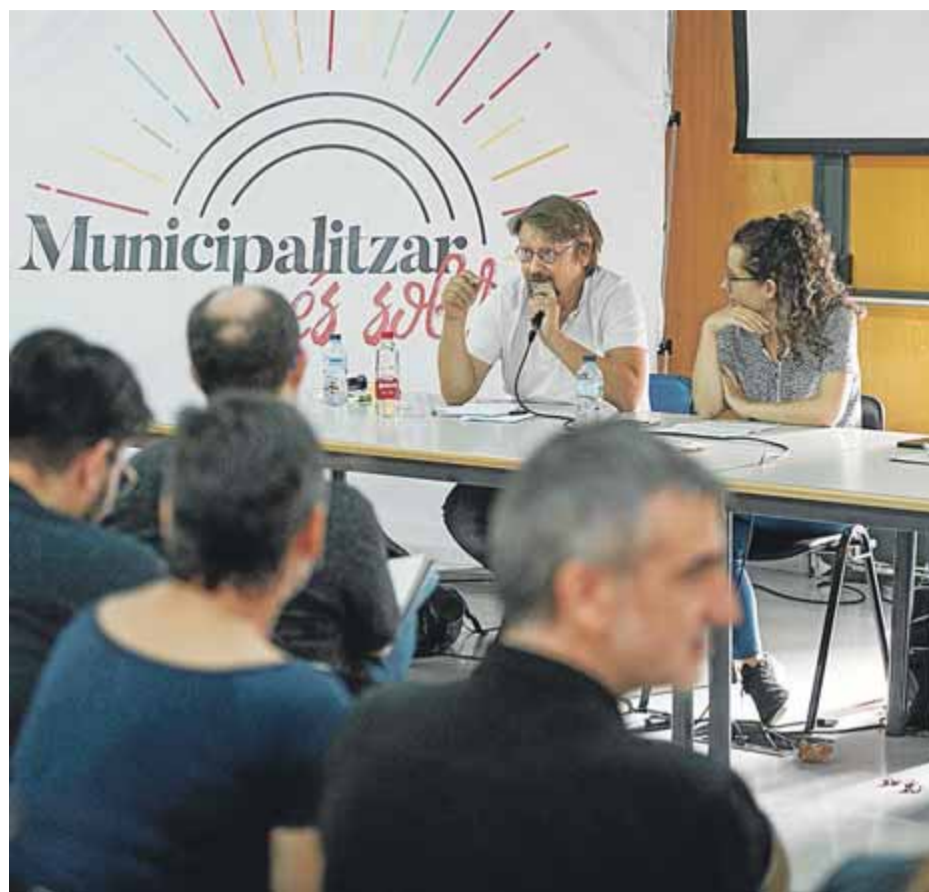
L'escola d'estiu de la CUP va tenir Xavier Domènech com un dels ponents

El manifest també assenyala que l'amnistia ha de ser un "element central de la reivindicació política" que s'hauria de perseguir mitjançant una "campanya intensa" tant a l'interior com a l'exterior de Catalunya. Aquesta amnistia, que s'hauria de vincular de manera "indefugible i explícita" amb el dret a l'autodeterminació, no afectaria únicament els lí-