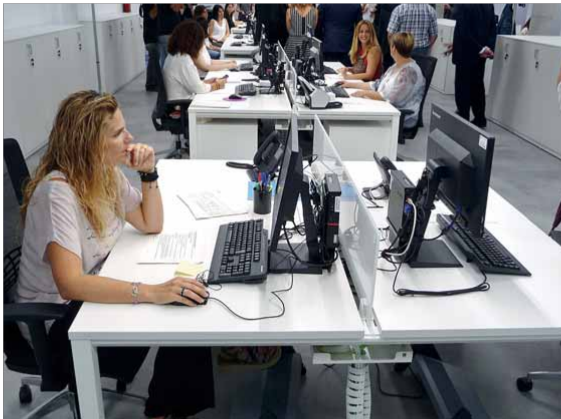
Una seu de l'Agència Tributària de Catalunya

Malauradament, els camins de la realitat no són així de plàcids... Primer entrebanc: el procés de