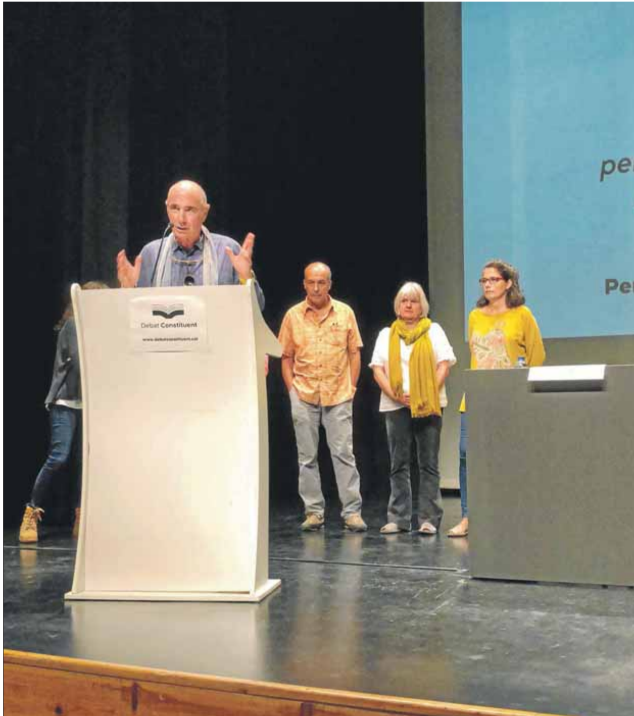
Lluís Llach , president del consell assessor del Debat Constituent, adreçant-se als assistents

Una discussió central que planteja la primera d'aquestes preguntes és quin hauria de ser el model d'estat de Catalunya que quedi recollit en la constitució. Hi ha quatre respostes tancades possibles. La primera és la d'un estat independent en forma de república. Poc més, o res, a afegir. També es proposa l'opció federal, que, inevitablement, implicaria que l'Estat espanyol assumís aquesta categoria; la d'una Catalunya confederada, o la d'un estat lliure associat, “que manté vincles constitucionals amb Espanya”. Aquestes dues últimes fórmules, entre molts altres matisos, implicarien un grau molt més elevat de sobirania respecte, per exemple, al