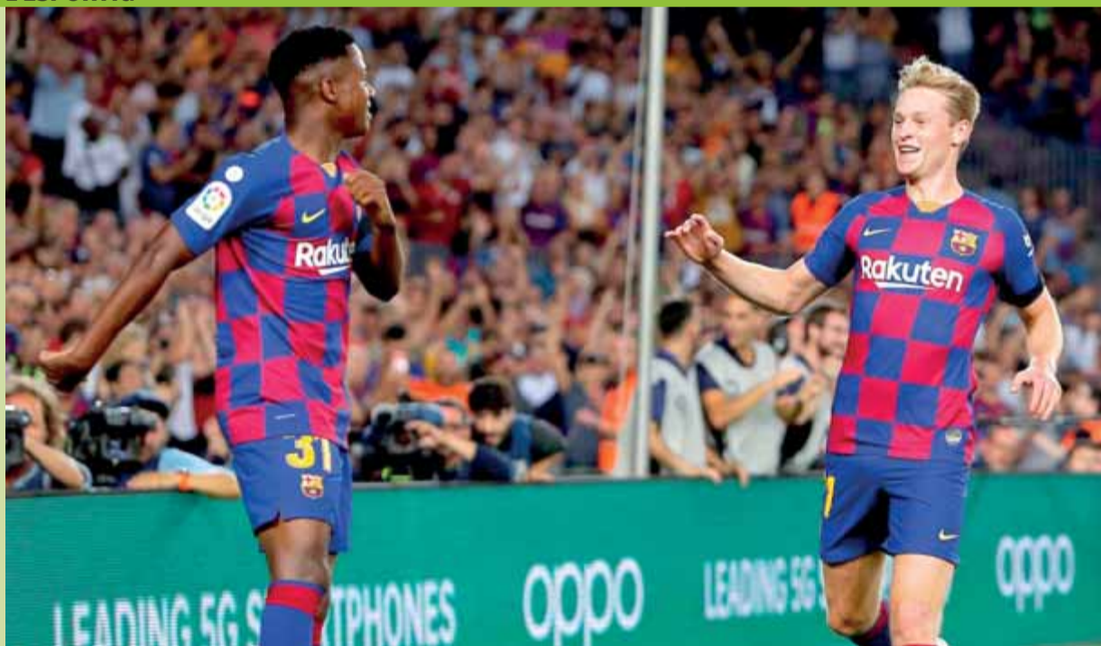
Frenkie de Jong felicita Ansu Fati per una jugada extraordinària que va permetre a l'holandès fer el segon gol