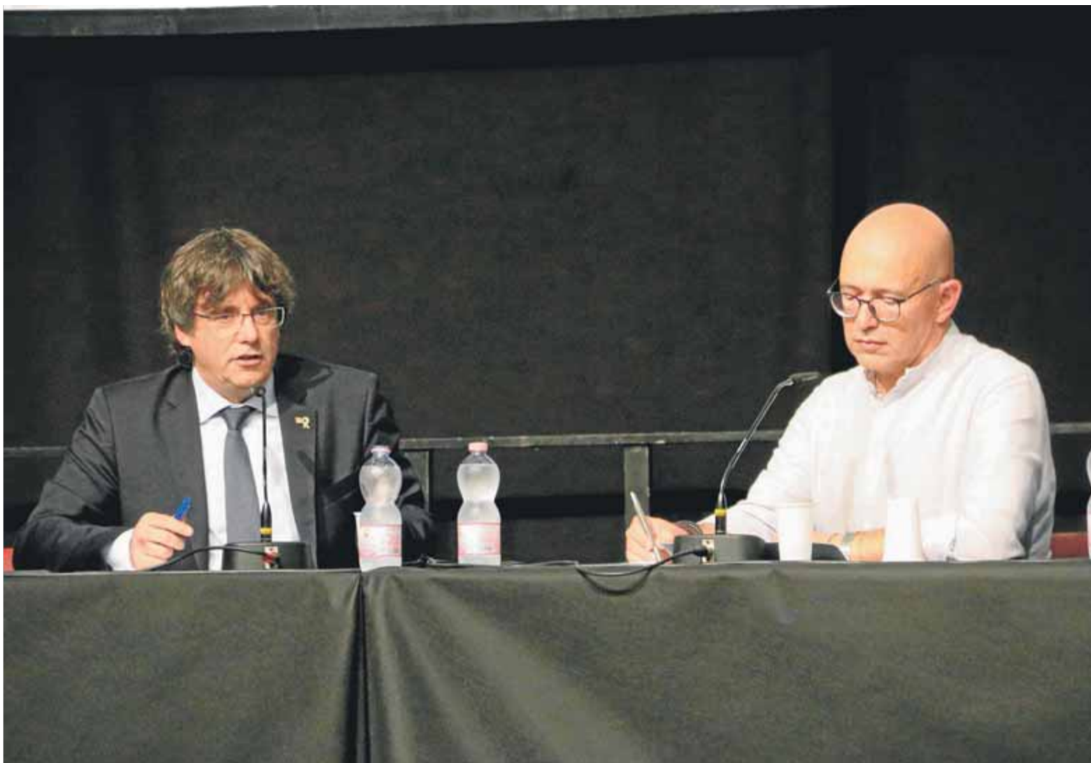
Carles Puigdemont i el periodista de l'RSI Sergio Savoia, durant una conferència a Lugano (Suïssa)