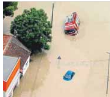
Un camió de bombers atrapat a Dolores, al Baix Segura

Pedro Sánchez visita el País Valencià i Múrcia, i Ximo Puig reclama ajudes per fer front a la reconstrucció