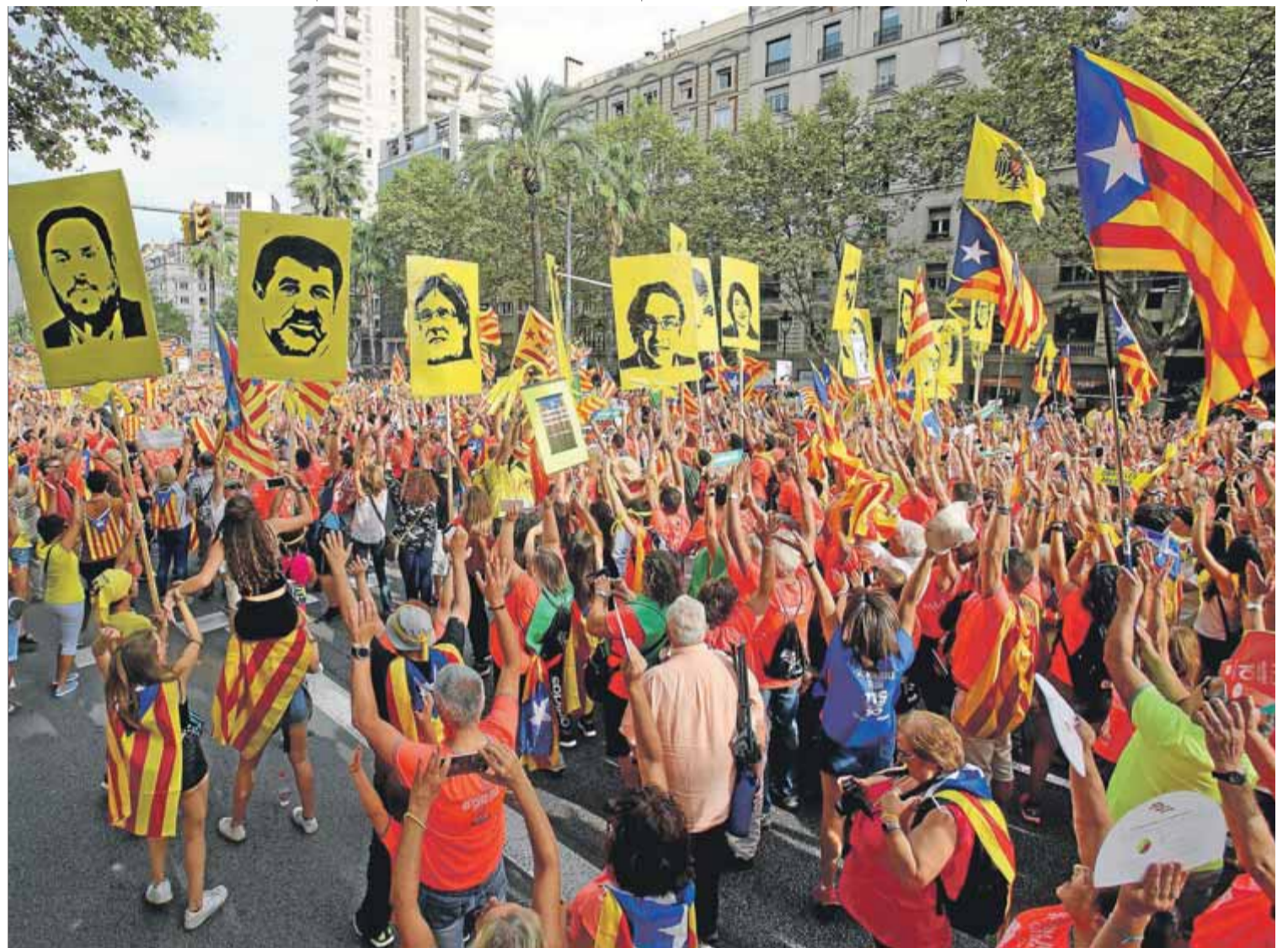
La manifestació de la Diada de l'any passat, amb fotos dels presos polítics i exiliats

L'11-S hem de dir alt i clar que l'única sentència justa és l'absolució de tots els encausats/des als tribunals. La vulneració dels