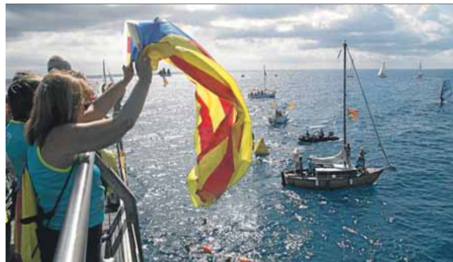
Molta gent va anar a rebre embarcacions i nedadors al Pont del Petroli