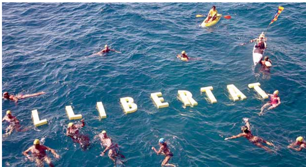
Un centenar d'embarcacions i nedadors van participar en la iniciativa de suport al procés

Article conjunt dels presos i exiliats: "Dignitat democràtica i llibertat"