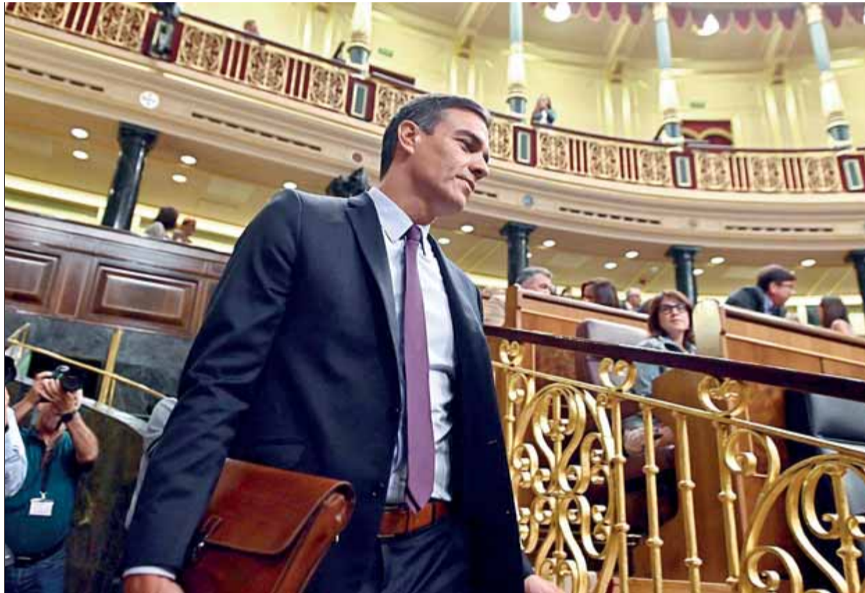
Sánchez tem que un ple d'investidura permeti a Iglesias donar-li un sí enverinat sense acord en res més

Després que Sánchez presentés el seu programa comú progressista de 370 punts amb escenografia electoral, Unides Podem ha acceptat entrar en el debat de les mesures però sense renunciar a formar una coalició com les que comparteix en