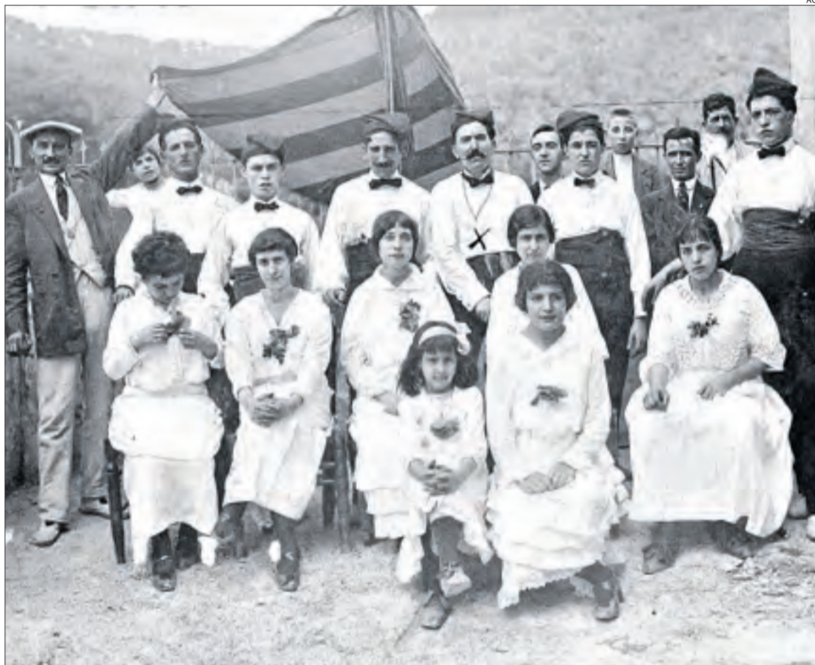
Fotografia d'arxiu del folklorista lleidatà al costat d'un grup de dansaires.