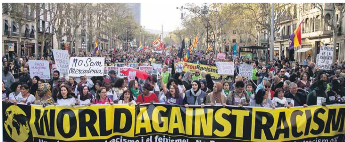
Manifestació massiva contra el feixisme i el racisme celebrada al març a Barcelona