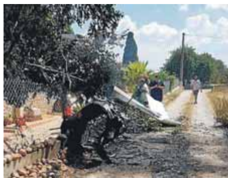
Les restes d'un dels aparells ■ BOMBERS

Els dos aparells, un helicòpter i un ultralleuger, van col·lidir per causes desconegudes