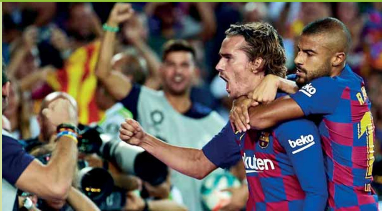
Antoine Griezmann celebra el seu segon gol d'ahir, que va portar la tranquil·litat als blaugrana