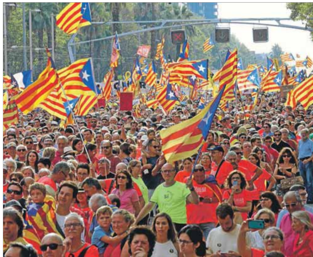
Vista general de la manifestació de l'11 de setembre de l'any passat ■ JUANMA RAMOS

Aquests dies hem percebut cert desànim, conseqüència de la manca d'estratègia compartida, en un context de repressió. Prendre les regnes també vol dir superar-lo, i el primer pas és generar una catarsi col·lectiva com la que vam viure el 2012 a Barcelona, durant aquella primera Diada massiva. Per això, aquest 11 de setembre hem de ser-ne molts. Més que mai. Perquè volem demostrar que el nostre objectiu segueix intacte malgrat la repressió i les divisions polítiques dels darrers mesos.