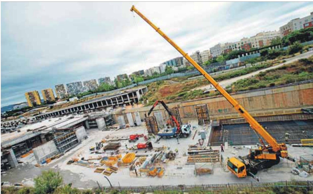
Una grua de grans dimensions treballant ahir en les obres de l'estació de la Sagrera

PASSOS • El pròxim pas serà col·locar les vies de la línia del Maresme, a mitjan 2020, i, divuit mesos després, les de Granollers