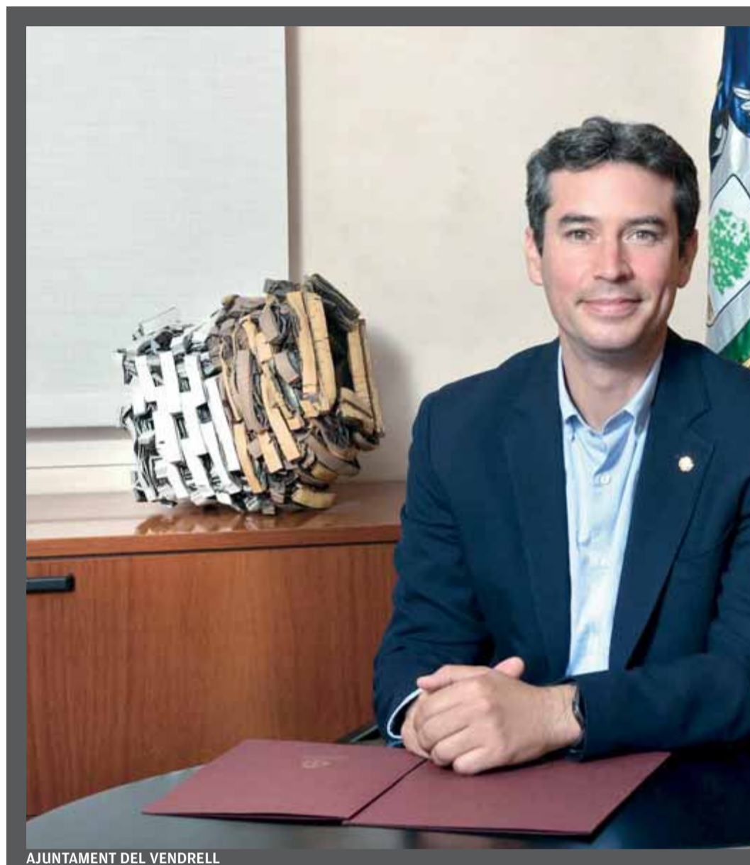
AJUNTAMENT DEL VENDRELL

És una bona oportunitat per a la ciutat i