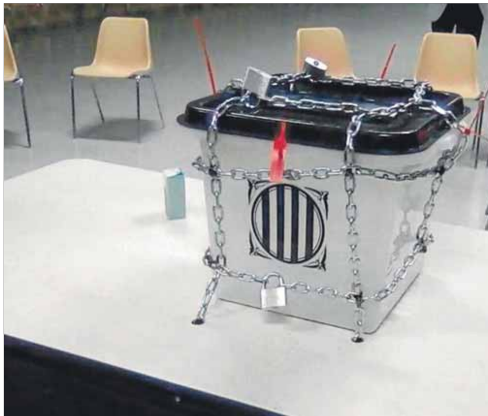
L'urna de l'1-0 encadenada en protesta per la prohibició del dret a l'autodeterminació

Un any intens en què he defensat sempre una actuació coherent amb la defensa del dret d'autodeterminació, que, en conseqüència, impedia tramitar el pressupost del govern espanyol, i que ens feia dir que no la setmana passada a la investidura d'un Pedro Sánchez perquè es va tancar a parlar de diàleg per a