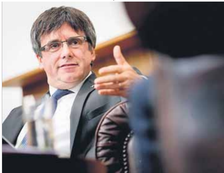
El 130è president de la Generalitat , en una xerrada a Holanda

Diu que l'única via per superar "la paret de l'Estat" és la confrontació no-violenta. De quina parla?