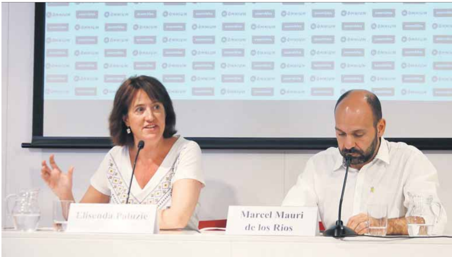
La presidenta de l'ANC i el vicepresident d'Òmnium compareixien ahir plegats per primer cop des de feia temps.