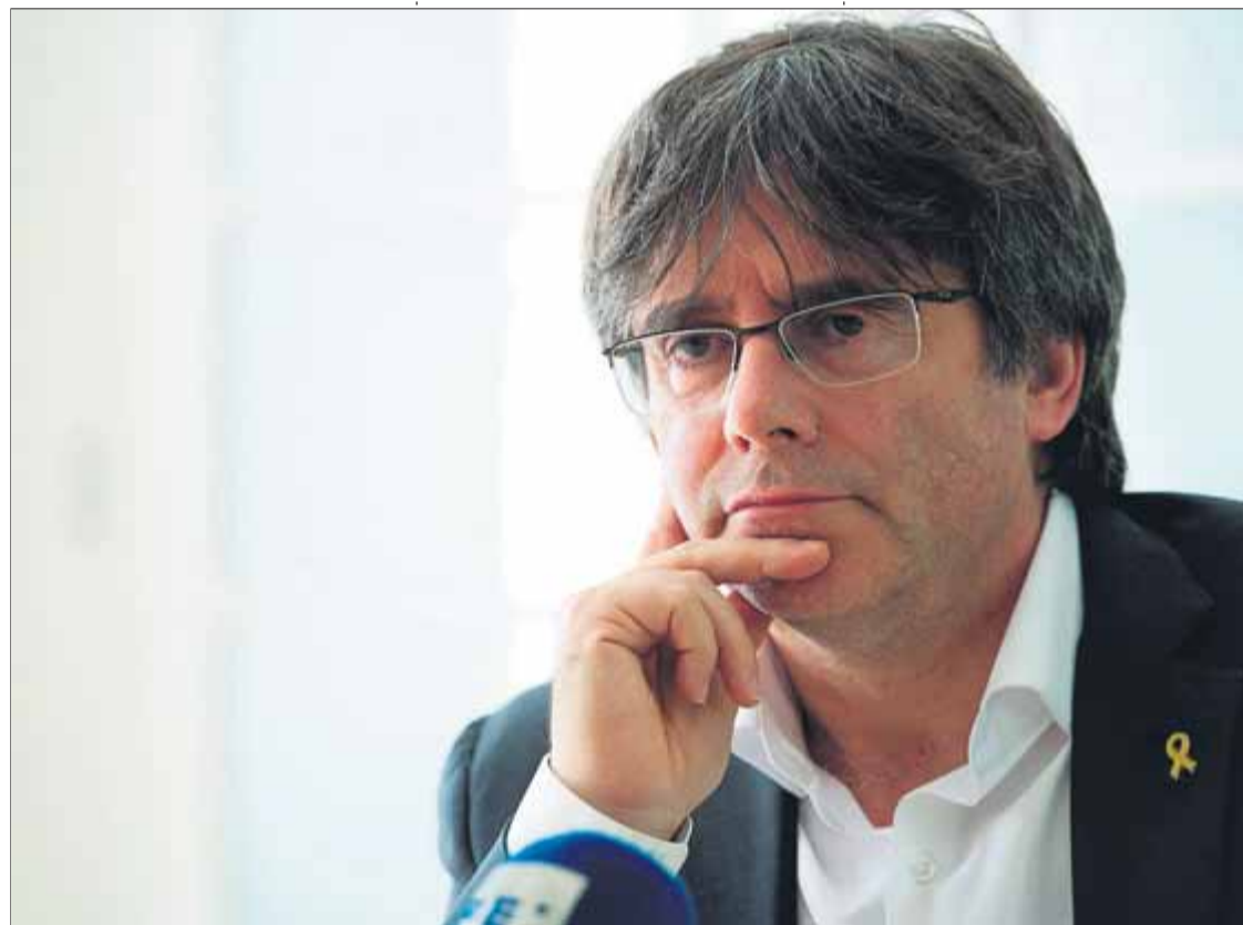
Carles Puigdemont , durant una entrevista a Waterloo, on està exiliat, el maig d’enguany

Concedint entrevistes, amb gent que t’interpreta sempre t’acaba distorsionant inevitablement el missatge. He preferit