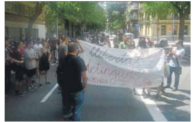
Més d'un centenar de persones es van concentrar davant la comissaria de les Corts en conèixer les detencions ■ Ò.P.J.

Puigdemont va fer aquell 7 d'abril en sortir de la presó de Neumünster, o en una manifestació al juliol a Potsdamer Platz, abans que, al setembre, es fes del tot efectiva la seva restitució en el càrrec. L'informe fa referència també a altres activitats en què va participar després, entre el setembre i el març passat, per la qual cosa Kapretz manté la "sospita inicial" que el seguiment "continua tenint lloc". ■