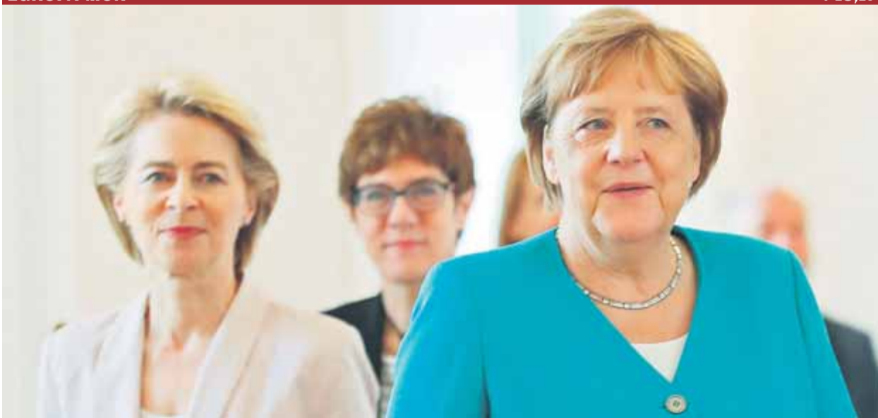
Merkel, en primer terme, i darrere seu, Ursula von der Leyen i Annegret Kramp-Karrenbauer