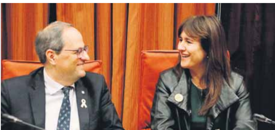
Torra i Borràs aposten per votar no a la investidura de Pedro Sánchez ■ ACN