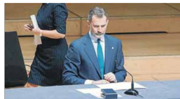
El rei, en un acte de l'escola judicial el 2018 a Barcelona

Els diputats al Congrés de JxCat consensuaran la decisió demà en una reunió a la presó de Lledoners amb Sánchez, Rull i Turull, però des del PDeCAT ja donaven ahir per fet que es ratificarà el vot contrari a Sánchez. ERC podria decidir demà en l'executiva l'aposta majoritària per l'abstenció, encara que no hi ha unanimitat entre les bases. El Col·lectiu Primer d'Octubre de militants aposta pel no. ■