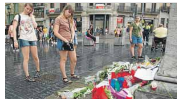
Flors per a les víctimes a la Rambla de Barcelona, lloc de l'atemptat de fa dos anys