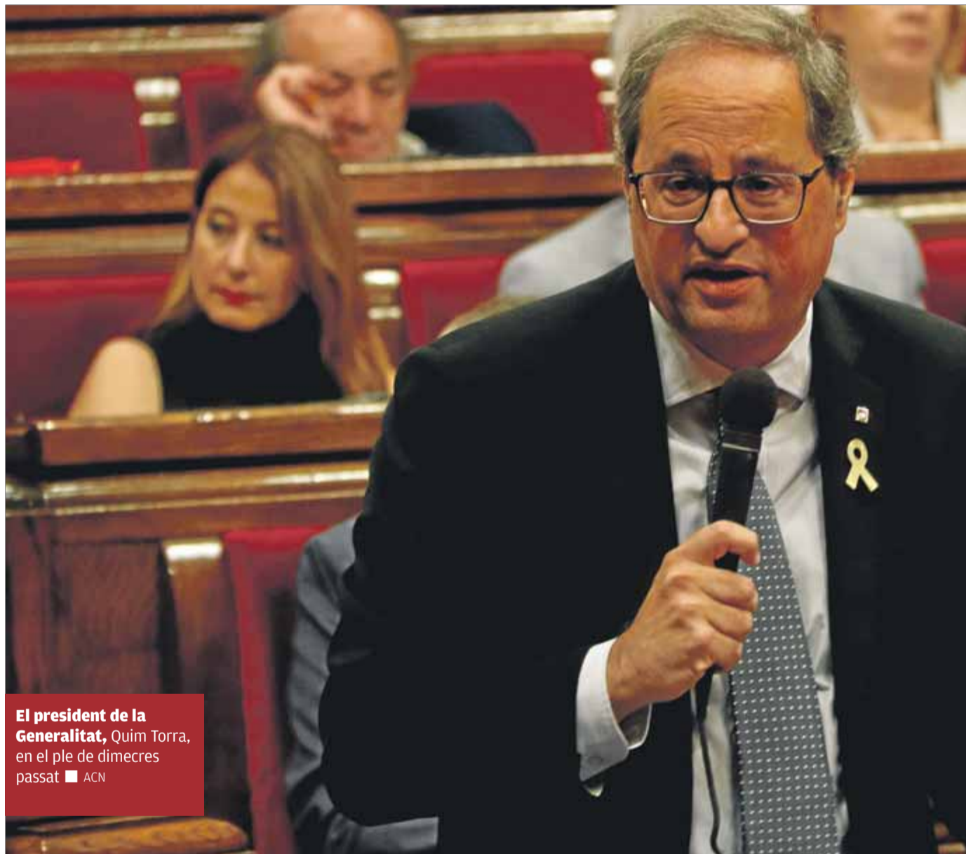
El president de la Generalitat, Quim Torra, en el ple de dimecres passat

El magistrat resumeix els indicis de la desobediència del president de la Generalitat a la JEC, amb un "incompliment conscient l'11 i el 18 de març". Hi exposa que, el 7 de març passat, Cs va demanar a la junta que ordenés la retirada de "simbologia i emblemes partidistes" del balcó del Palau de la Generalitat i dels edificis públics, que, segons la jurisprudència del Suprem –in-