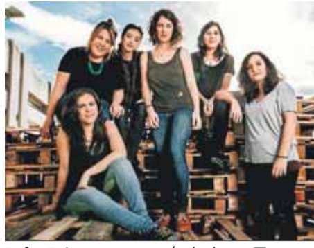
Roba Estesa, grup només de dones

Representen un terç de la indústria i un 23% dels festivals, segons l'Anuari 2019'