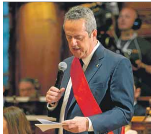
Joaquim Forn el dia del ple de constitució

El jutjat d'instrucció número 7 de Martorell (Baix Llobregat) ha arxivat les tres denuncies que quedaven obertes contra els docents de l'IES El Palau de Sant Andreu de la Barca, investigats per presumptament haver menyspreat alumnes fills de guàrdies civils després del referèndum de l'1-O i les càrregues policials viscudes. Segons ha pogut saber l'ACN, el jutge ha conclòs que no hi ha suficients indicis per mantenir la causa oberta pels delictes d'odi i contra la integritat moral. El mateix jutge ja va arxivar mesos enrere cinc altres causes similars, i el jutjat d'instrucció número 3 de Martorell va fer el mateix amb una investigació sobre un altre professor. L'Associació Espanyola de la Guàrdia Civil ja ha avançat que recorrerà contra l'arxivament a l'Audiència de Barcelona, com ha fet amb les altres causes tancades. L'Audiència de Barcelona i el TSJC han dictat resolucions en què deixen clar que els cossos policials no estan protegits en els anomenats delictes d'odi, que són per a grups vulnerables.