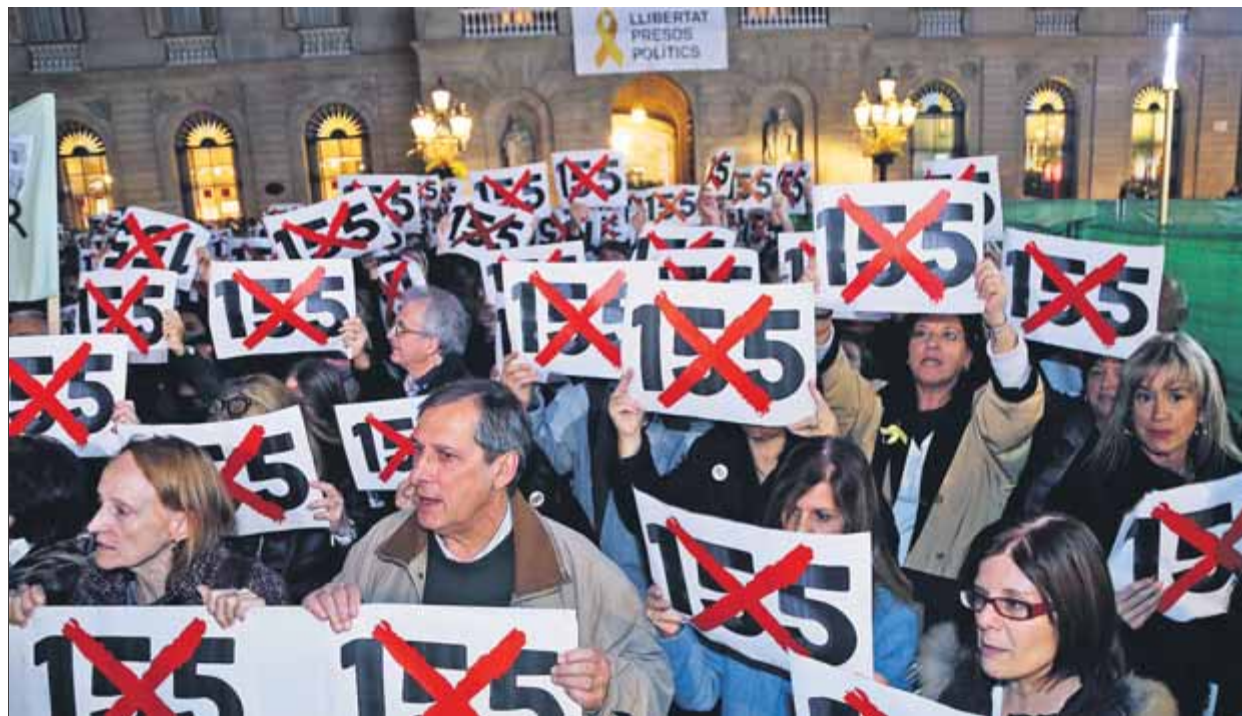
Treballadors de la Generalitat es van concentrar el novembre del 2017 en contra de l'article 155

L'aplicació, per primera vegada en la història, de l'article 155 de la Constitució arran dels fets d'octubre del 2017 a Catalunya, i més concretament per la celebració del referèndum de l'1-O i la declaració simbòlica d'independència del 27-S, va fer aflorar tot un conjunt de dubtes sobre l'abast d'aquest mecanisme d'intervenció estatal. Un dels punts més polèmics va ser la dissolució de la cambra autonò-