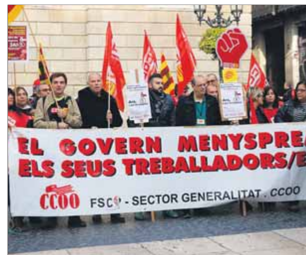
Concentració de treballadors, el novembre del 2018, per reclamar les pagues extres als funcionaris

dels objectius de dèficit, deute i la regla de despesa del 2018 i “desactiva qual-sevol amenaça” d'aturar el retorn de les pagues del 2013 i 2014, celebren des del govern. I és que la regulació actual espanyola impedeix a les administracions públiques tornar les retribucions pendents si no han complert l'objectiu de dèficit i de deute i el sostre de despesa. Les mateixes fonts també recorden que aquelles “amenaces” es van fer en plena campanya electoral de les eleccions generals del 28 d'abril. ■