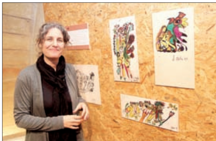
Carolina Blàvia también organiza el InterFado

'Destino meu' es el resultado del trabajo de esta artista en los últimos cinco años, contiene 11 canciones con letra y música de la propia autora. El repertorio que ofrecerá en ambos concier-