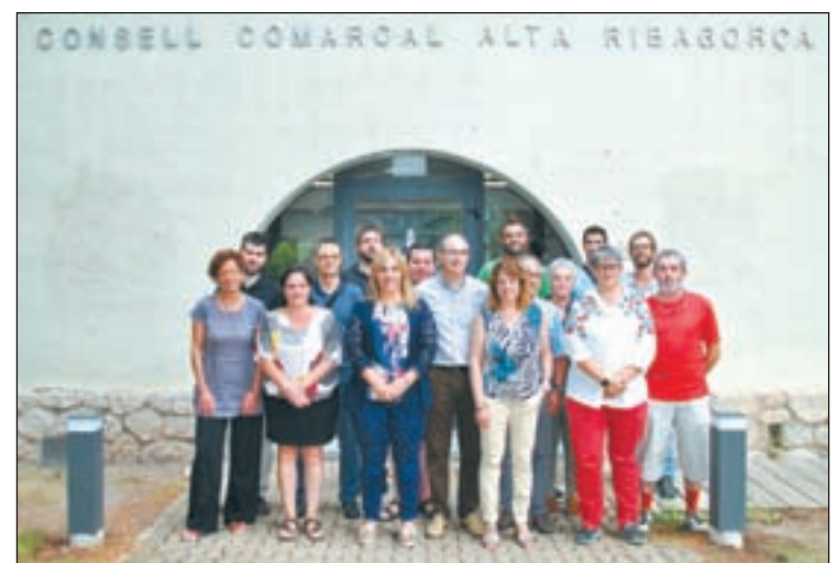
Els membres que conformen el nou consell