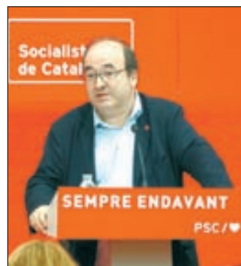
Miquel Iceta