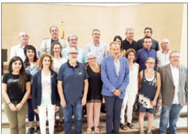
Els consellers i conselleres d'aquest nou mandat