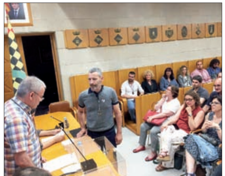
Moment de l'elecció del nou president comarcal

El nou president va afirmar ahir que a partir d'ara treballarà per tenir una "governança republicana amb la transparència i la lluita contra la corrupció" com a principals eixos. No és el primer