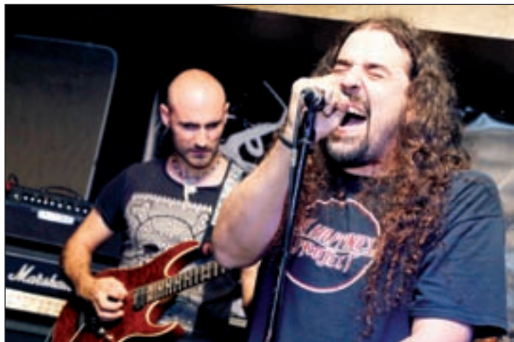
FOTO: Oriol Cárceles / Blindpoint, segundos en el XII Pepe Marín Rock

'Through the ashes of life' es el título del álbum de debut de los leridanos Blindpoint, cuyo preestreno se realizará el próximo sábado (19.00 horas) con una presentación oficial en concierto se llevará a cabo durante el próximo otoño. El álbum contiene siete canciones cantadas en inglés en un total de 50 minutos que describen la proyección de lo que el propio título anuncia: "la huella de la desolación como resultado de nuestro paso por la vida, la autoaniquilación representada en cenizas", reflexiona este quinteto que compagina dureza con melodías en su propuesta.