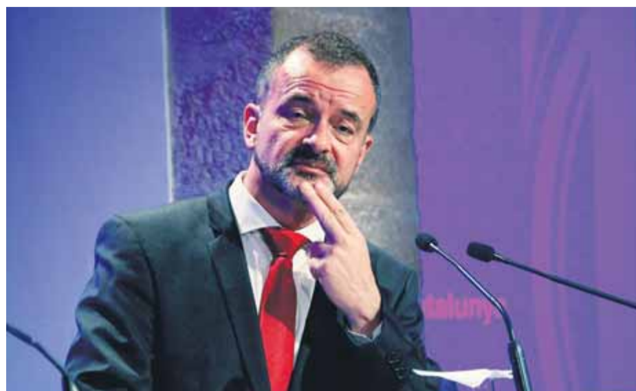
El conseller d'Acció Exterior, Alfred Bosch, ahir en roda de premsa al Palau

El pla planteja augmentar la presència "econòmica, social, científica i cultural" de Catalunya a l'exterior. Consolidar l'estructura exterior, internacionalitzar l'economia i la cultura, ampliar les relacions amb governs i exercir la solidaritat internacional en són els eixos. ■