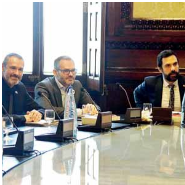
Els membres d'ERC i de JxCat de la mesa van votar ahir diferent sobre la tramitació de la ILP sobre la DUI ■ ACN

pels lletrats de la cambra, deixava ben clar que el text presentat no complia les condicions per ser acceptat perquè la llei catalana del 2006 que regula les ILP les ceneix a "les matèries sobre les quals la Generalitat té reconeguda la seva competència", i l'objecte d'aquest text requeriria "una reforma constitucional". Els republicans, tot i això, van decidir no votar-hi en contra per no alinear-se amb el PSC i Cs, mentre que JxCat hi va votar a favor perquè entenia que davant el "dubte" jurídic i "l'ambigüitat" de la llei calia fer la interpretació més laxa possible per permetre el debat. "Avui la mesa ha