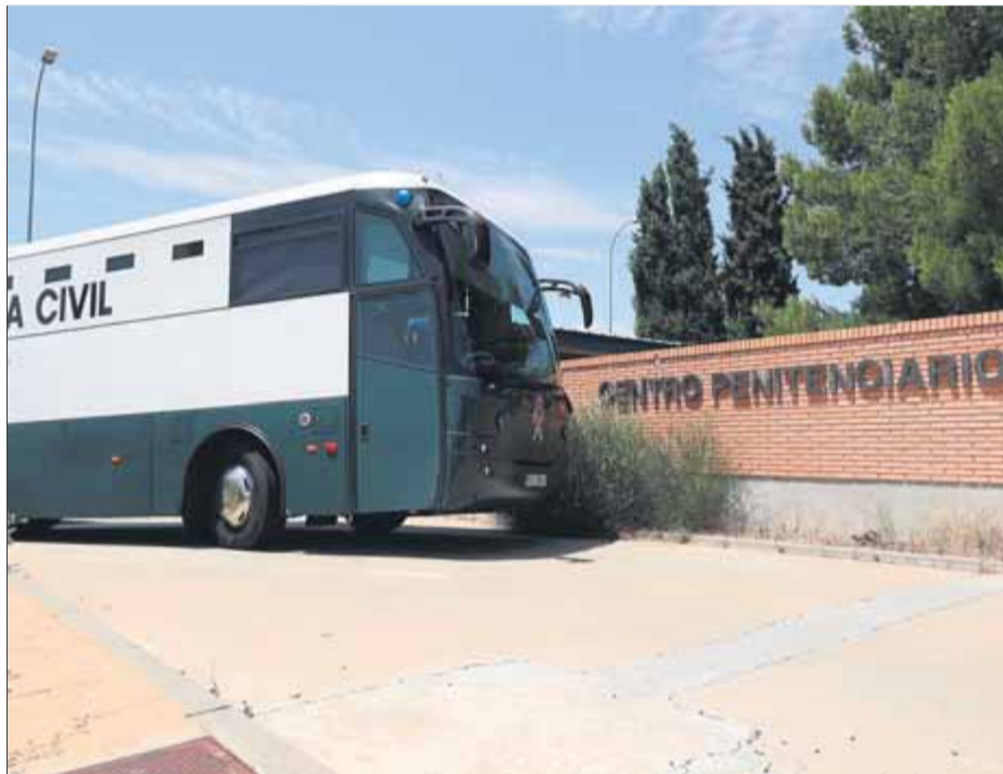
L'autocar dels presos entrant ahir a la presó de Zuera de Saragossa

El govern català va criticar el dispositiu dissenyat per Institucions Penitenciàries, que la portaveu de