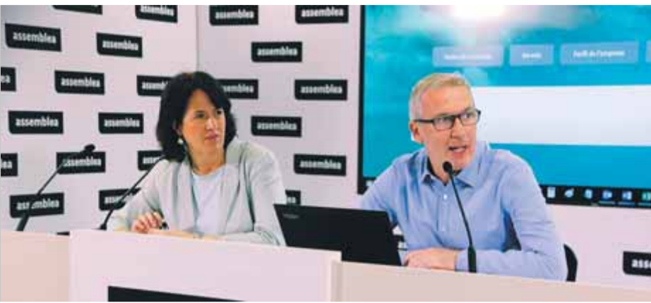
La presidenta de l'ANC i el coordinador de la iniciativa, ahir a la seu de l'entitat ■ ACN