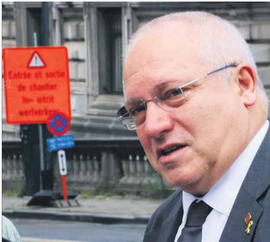
L'exconseller de Cultura Lluís Puig, abans d'entrar als jutjats de Brussel·les per declarar per videoconferència sobre Sixena

Tant la fiscalia com l'Ajuntament de Vilanova de Sixena acusen Puig de no haver obeït les ordres judicials per lliurar les 44 peces originàries del monestir de Sixena que hi havia al Museu de Lleida i que finalment es va endur per la força la Guàrdia Civil l'11 de desembre del 2017,