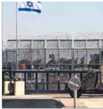
Control israelià al Golan

L'exèrcit israelià va ocupar aquesta part del territori sirianès fa 52 anys i ara el govern agraeix el gest nord-americà