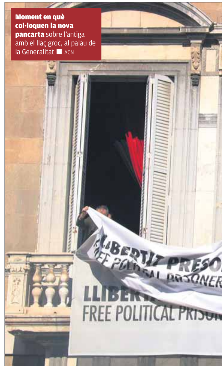
Moment en què col·loquen la nova pancarta sobre l'antiga amb el llaç groc, al palau de la Generalitat

L'instigador de la polèmica, Ciutadans, va presentar ahir una denúncia a la JEC també pel llaç blanc,