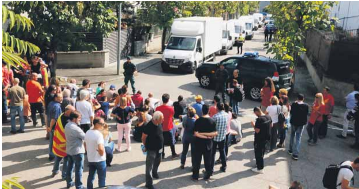
Veïns concentrats a Bigues i Riells, contra els escorcolls de la Guàrdia Civil, el 20 de setembre del 2017

Així, per mantenir el relat violent de la fiscalia, dos agents que van intervenir en els escorcolls de la nau d’Unipost, a Terrassa –per una alerta anònima i inicialment sense ordre judicial–, van exagerar una sortida accidentada ja que la unitat dels Mossos, per error, els va conduir a un carrer estret i en obres. “Tombaven les tanques,