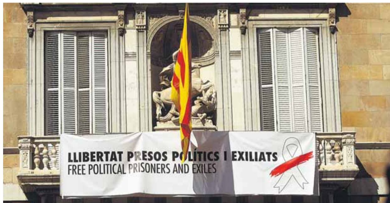
El Palau de la Generalitat, ahir al matí amb la nova pancarta

CANVI • Apareixen alternatives als llaços grocs, mentre la JEC porta Torra a la fiscalia i ordena la retirada de símbols