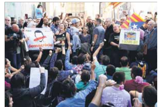
Manifestants, davant d'Unipost a Terrassa

cosa certa i que aquell dia ningú que era allà va entendre, ja que un cop alliberat el carrer, tenien sortida directa. Els mateixos, però també altres, van insistir en la cara d'odi dels manifestants, com si intentessin que aquesta sensació passés a ser un agreujant.