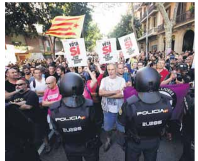
Els concentrats a la seu de la CUP, a Barcelona, contra els escorcolls que volia fer la policia espanyola el 20-S