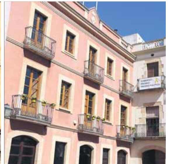
La pancarta dels peixos del Port de la Selva, el laç blanc de la delegació de la Generalitat a Girona, el missatge "Llibertat" al consistori de Salt, i torretes amb flors grogues a l'ajuntament del Catllar