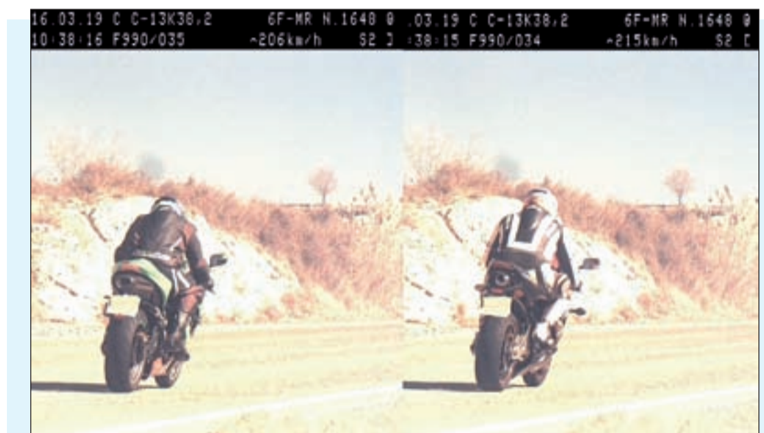
Els dos motoristes, enxampats en el control de velocitat dels Mossos d'Esquadra

D'altra banda, dissabte dia 16 a la nit una patrulla va localitzar un vehicle accidentat a l'LV-2003, al terme dels Alamús. El conductor estava il·lès, però presentava signes evidents de trobar-se sota els efectes de begudes alcohòliques. Els agents van efectuar la prova d'alcoholèmia al conductor, que va donar un resultat positiu