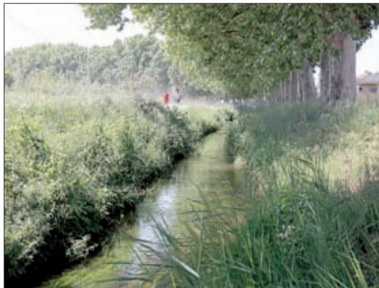
El Canal al seu pas per la ciutat de Mollerussa

La modernització busca que els regants substituïxin l'actual reg a manta o per inundació per reg més sostenible i eficient com